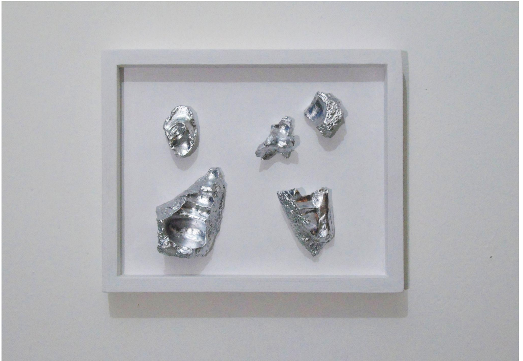
“RI-NASCITA”, gesso alabastrino, foglia argento, legno dipinto 35 x 28 x 4 cm, 2021. Proprietà di “Istituto di Candiolo”