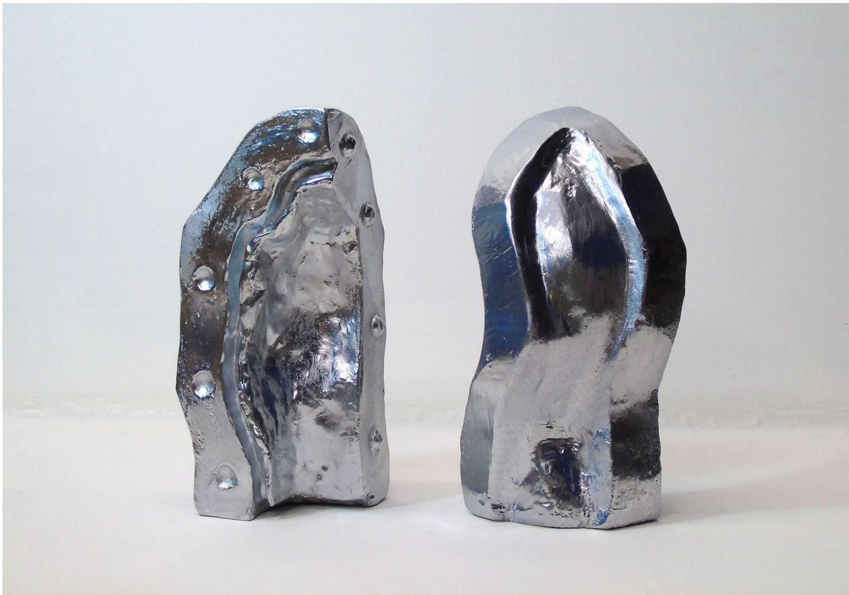
“Studi sulla forma”, gesso alabastrino e vernice cromata 25 x 15 x 15 cm cadauno, 2020)