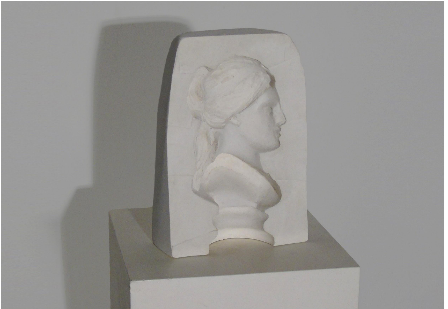
“Afredite”, gesso alabastrino, 15 x 10 x 8 cm, 2020