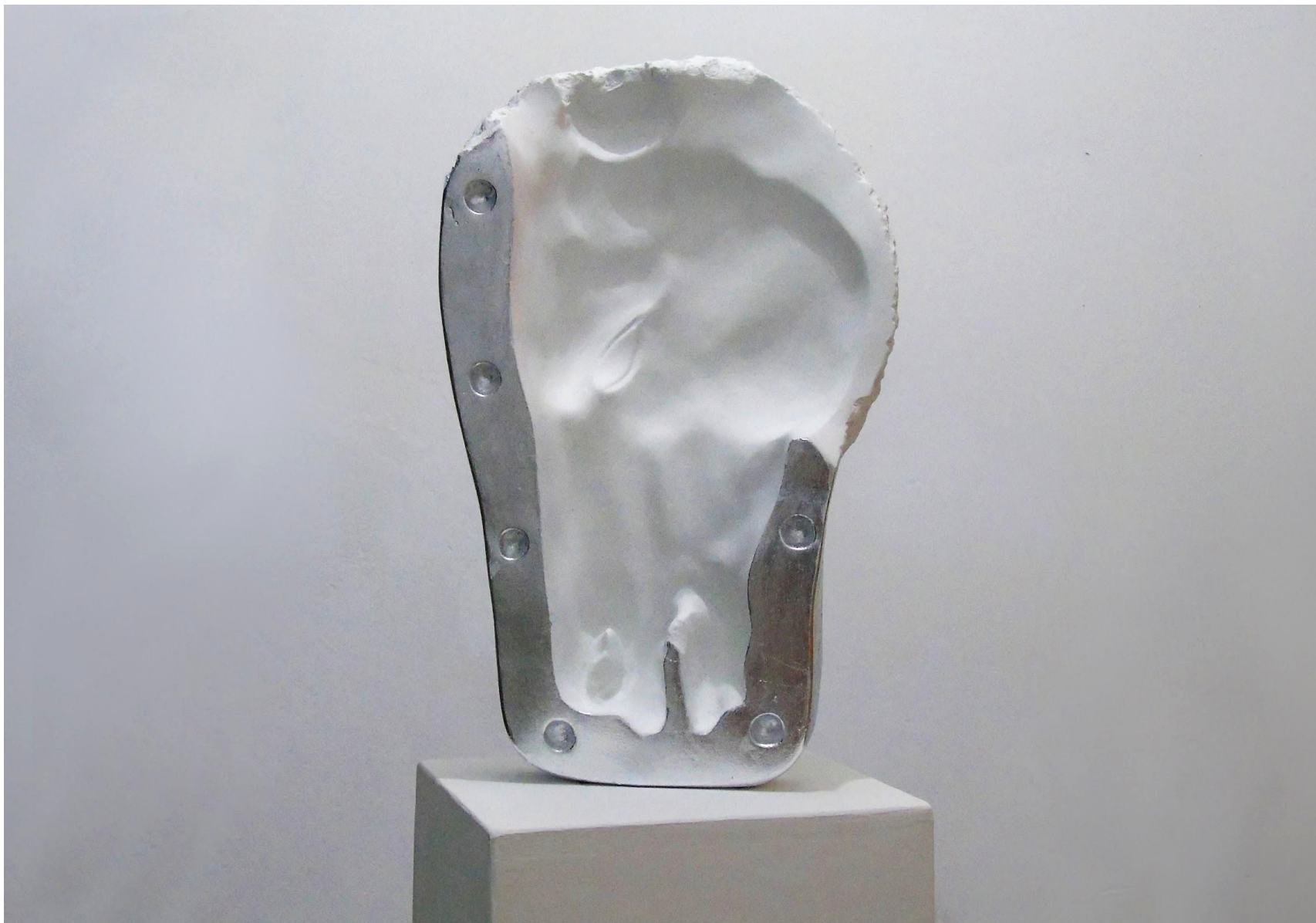
“Chios”, gesso alabastrino e foglia argento imitazione 145 x 27 x 20 cm, 2020 - foto A.Brandimarte. Collezione PRS Impresa Sociale.