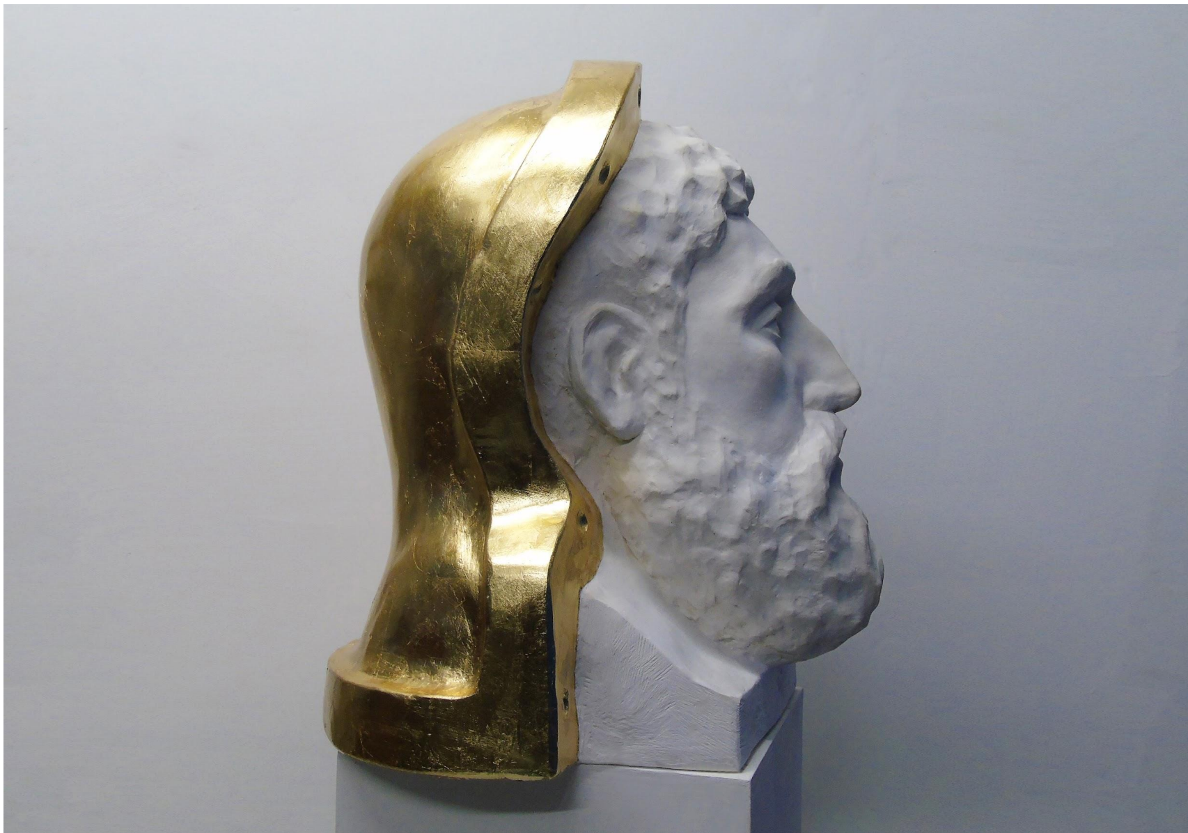
“Ercole”, gesso alabastrino e foglia similoro 55 x 45 x 35 cm, 2020 - foto A.Brandimarte. Collezione G.Viviani.