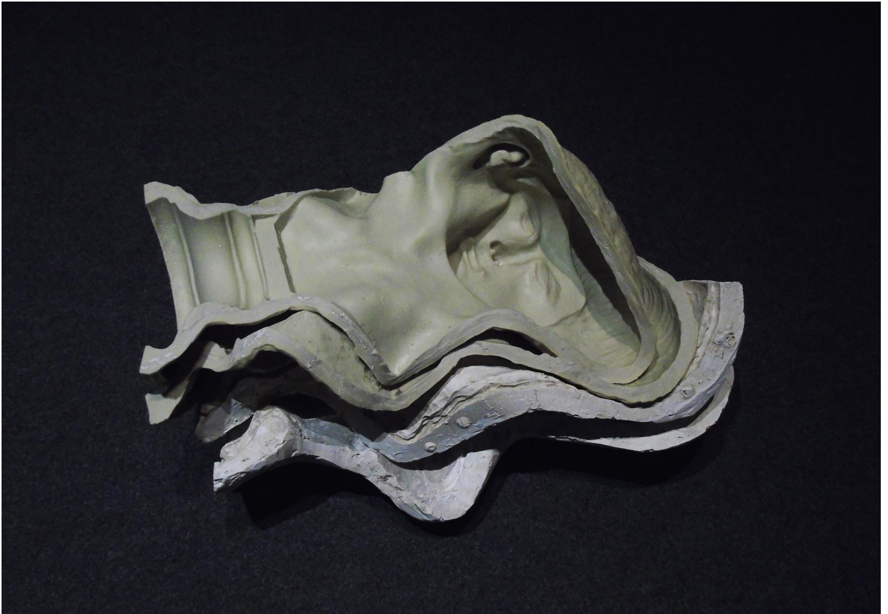
“Scomposizione di una formatura”, gesso alabastrino e gomma siliconica, 69 ^ Premio Salvi , Palazzo della Pretura, Sassoferrato (AN) 60 x 45 x 35 cm