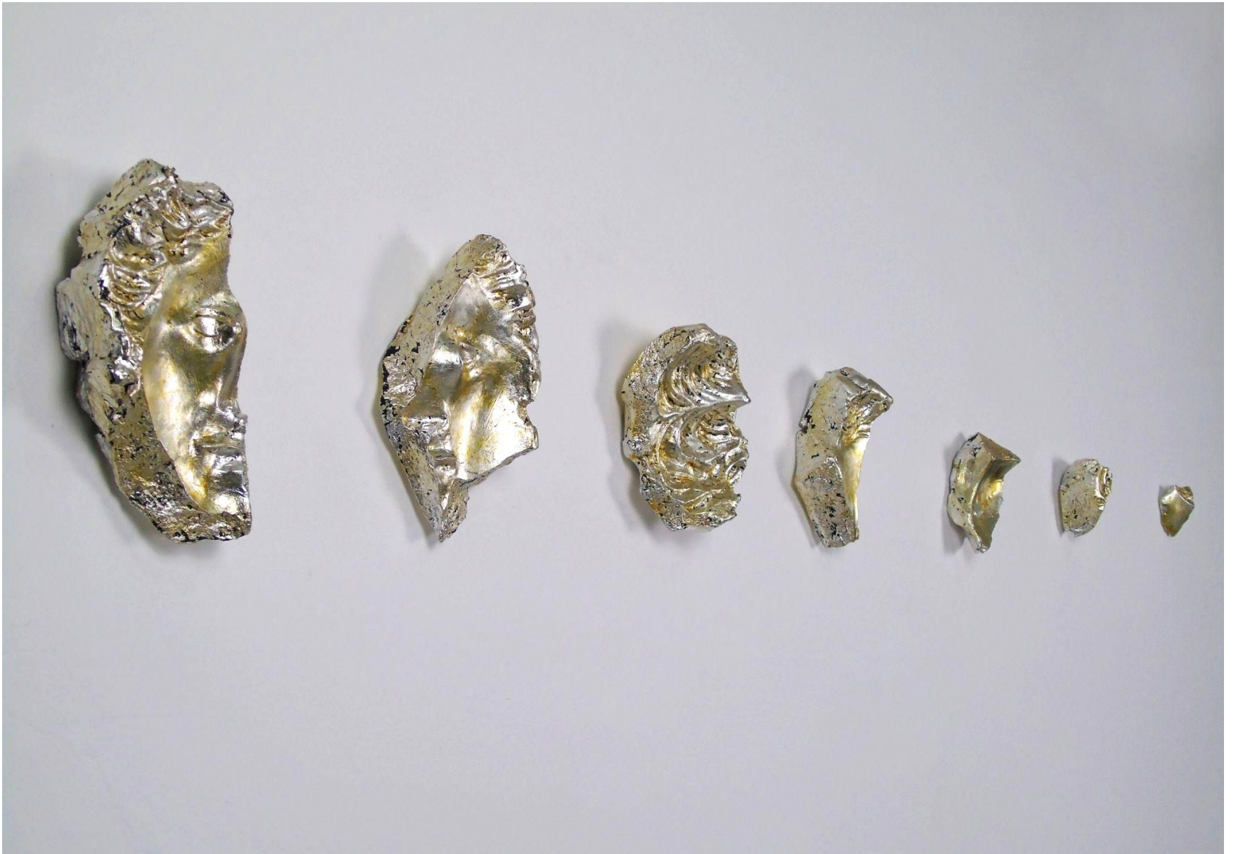
“Nascita di Venere”, gesso alabastrino foglia argento imitazione e gommalacca, dimensioni variabili, 2022