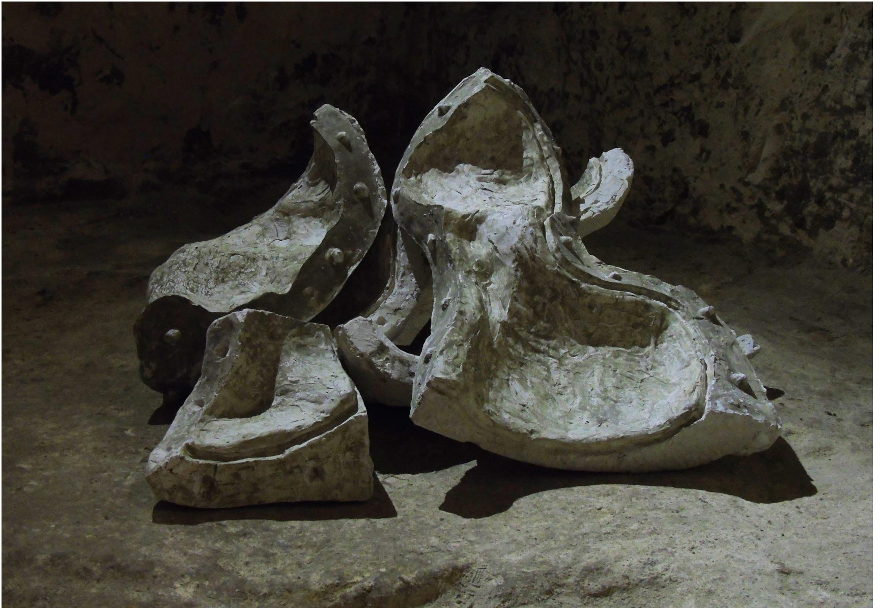
“Venere di Milo”, gesso alabastrino, dimensioni variabili, 2019. “Logos Mundi”, Ipogeo Materasum, Matera