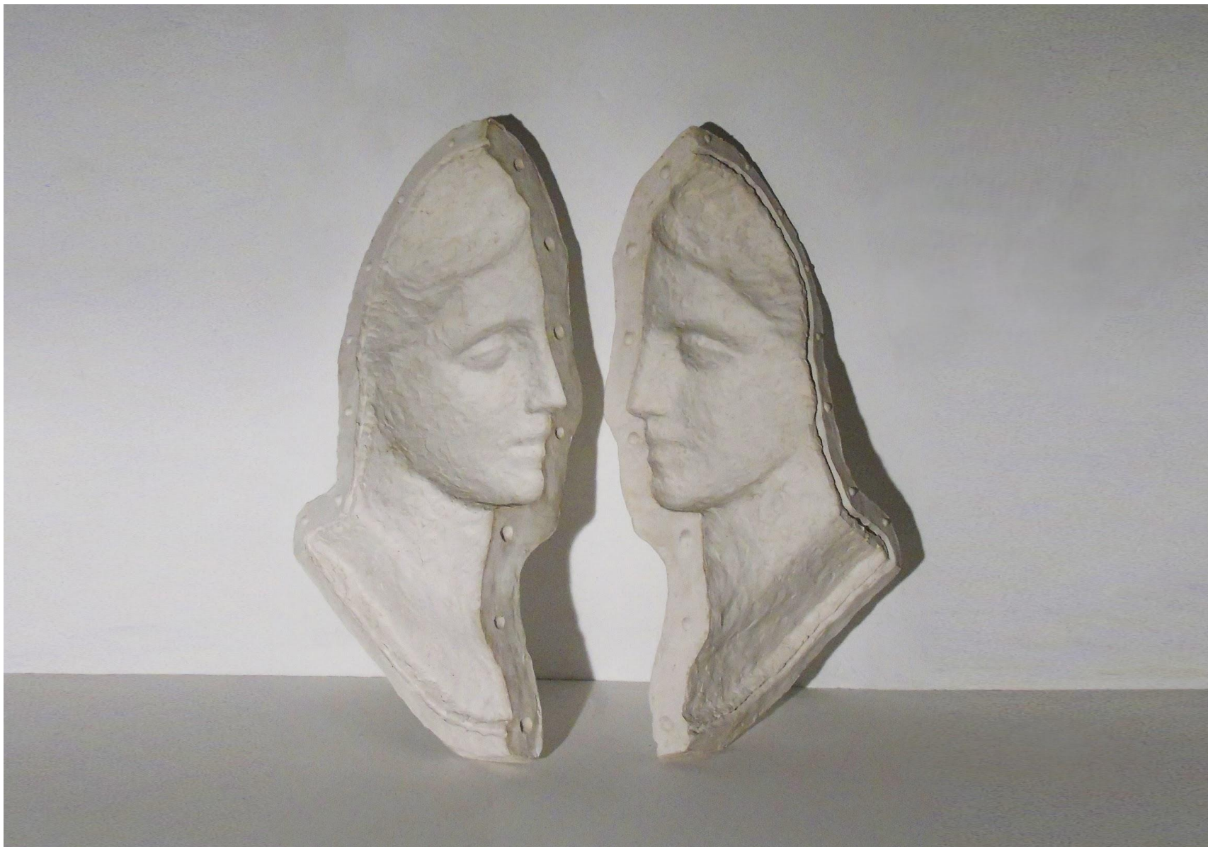
“Two sides of you”, gesso alabastrino, dimensioni variabili (circa 100 x 50 x 30 cm cadauno), 2019 DISPONIBILE