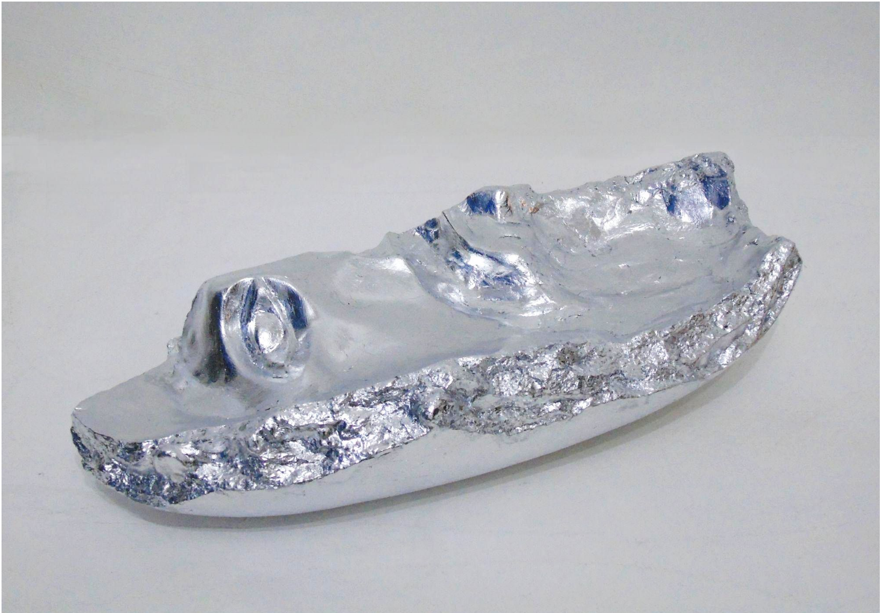
“Ricordo”, gesso alabastrino, foglia argento imitazione e termoplastica, 40 x 15 x 20 cm, 2021