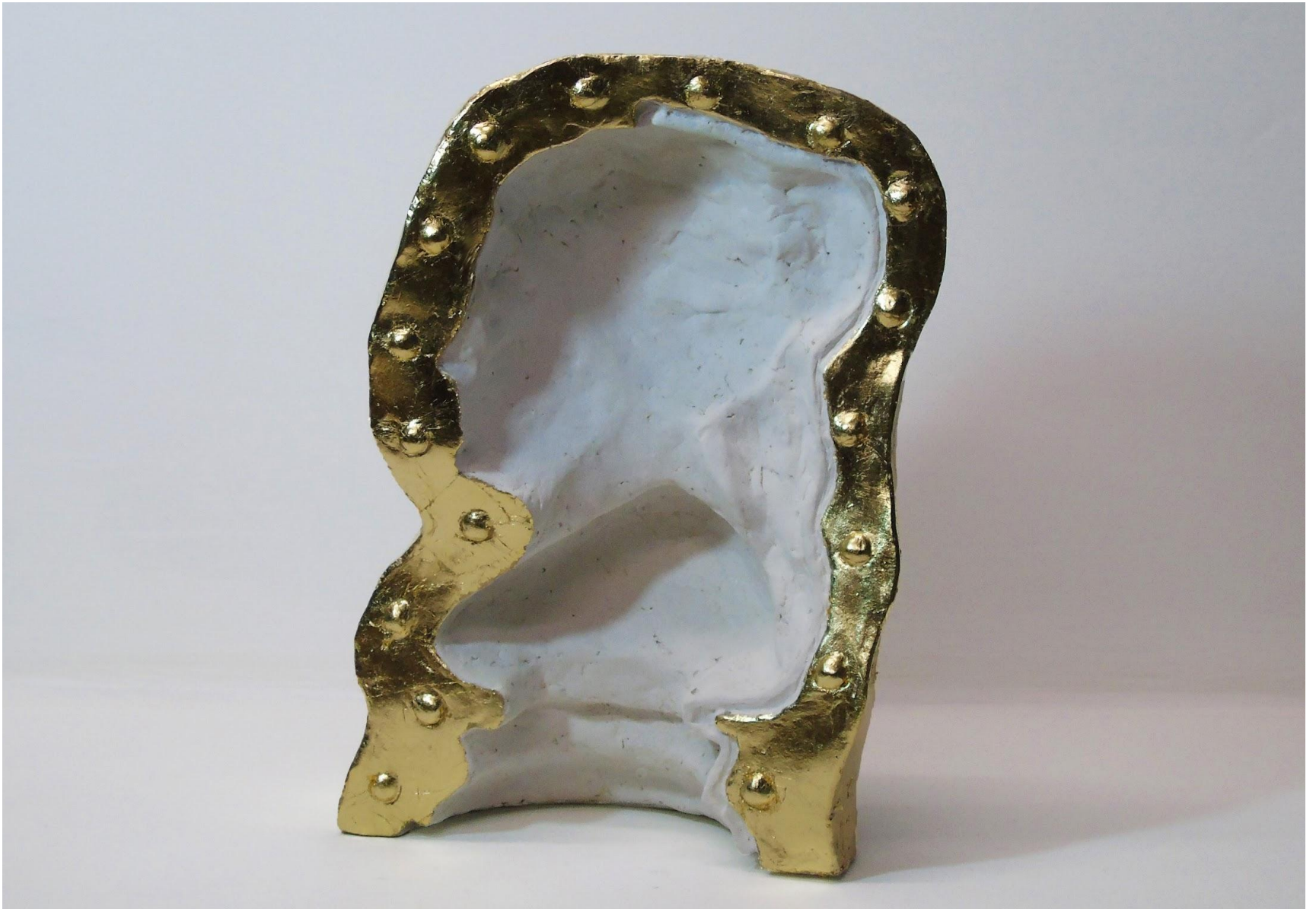
“Cambio d’ attenzione ”, gesso alabastrino e foglia similoro 30 x 22 x 10 cm, 2019 - foto A.Brandimarte. Collezione privata.