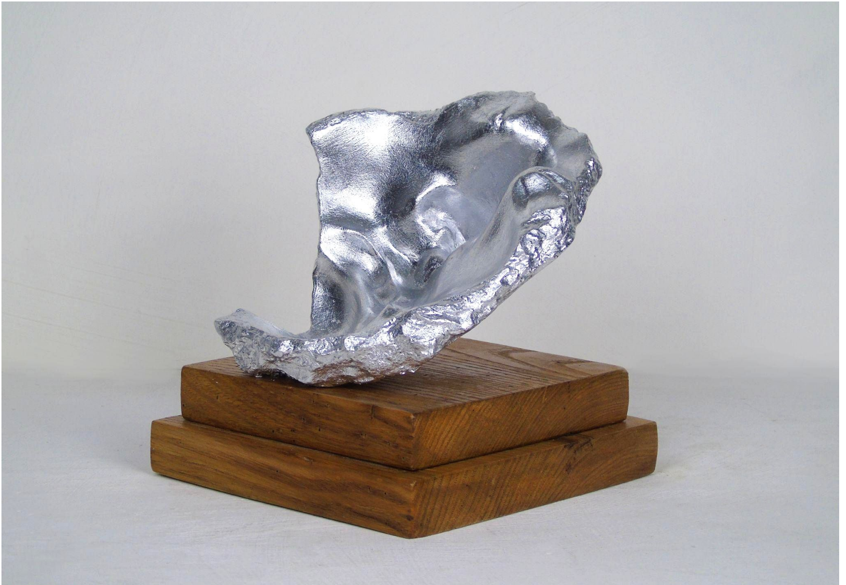
“Formatura Ornamentale #3”, gesso alabastrino, foglia argento imitazione, legno di castagno, termoplastica 20 x 15 x 15 cm, 2021