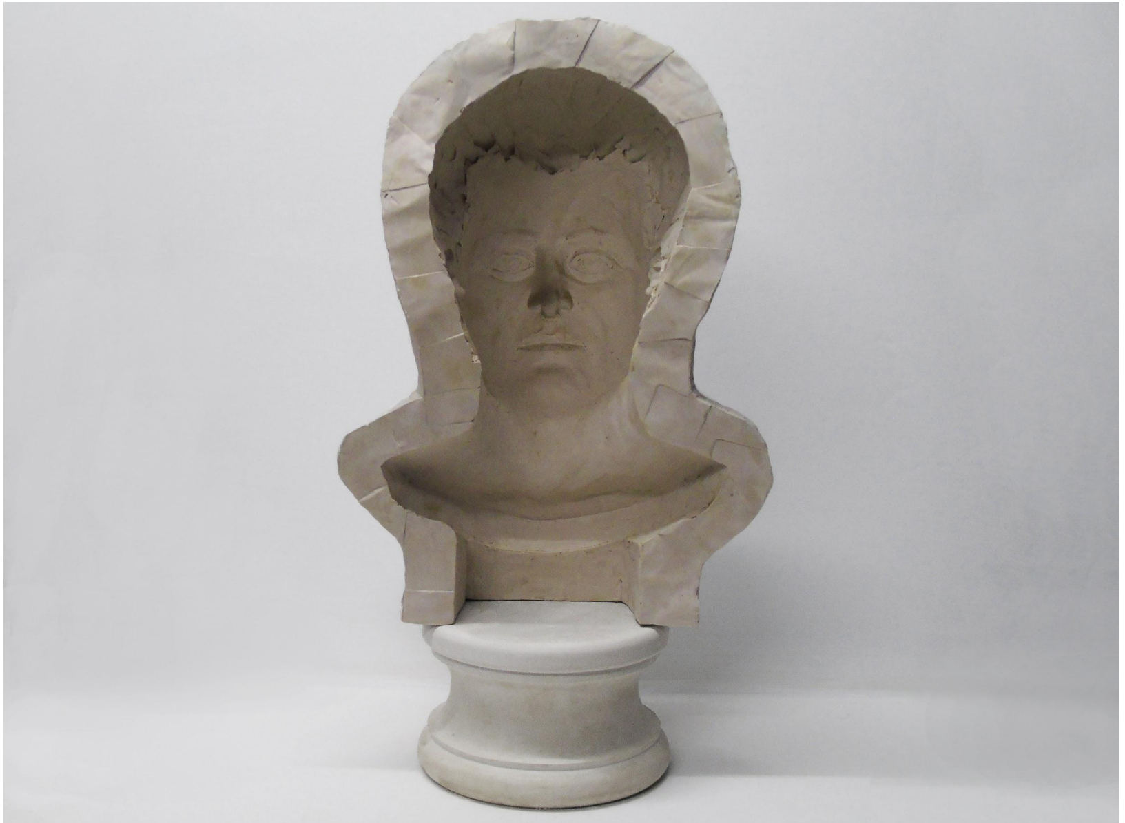
“A perdere - Tributo ad Antonio Canova”, gesso alabastrino, pigmento 50 x 35 x 20 cm, 2019