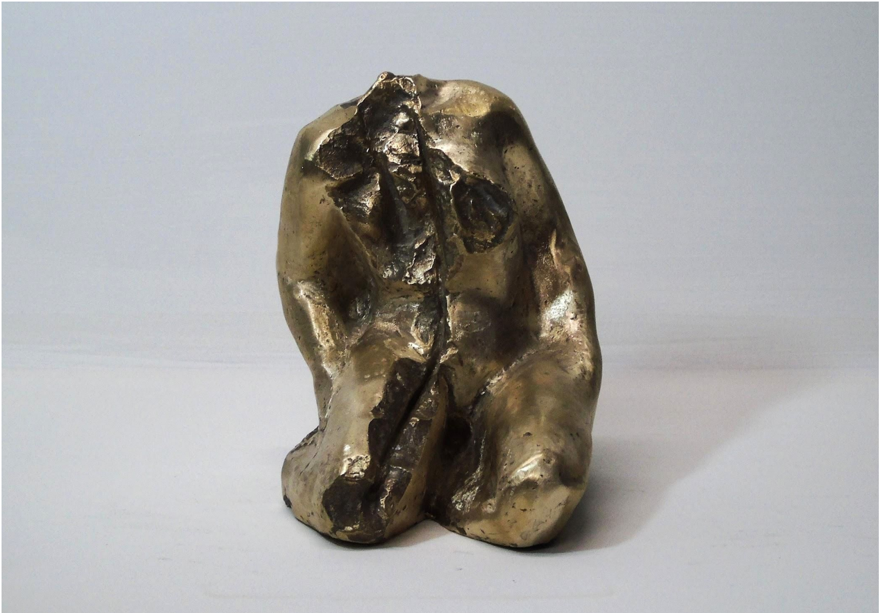
“Modellato”, bronzo 16 x 12 x 15 cm, 2019