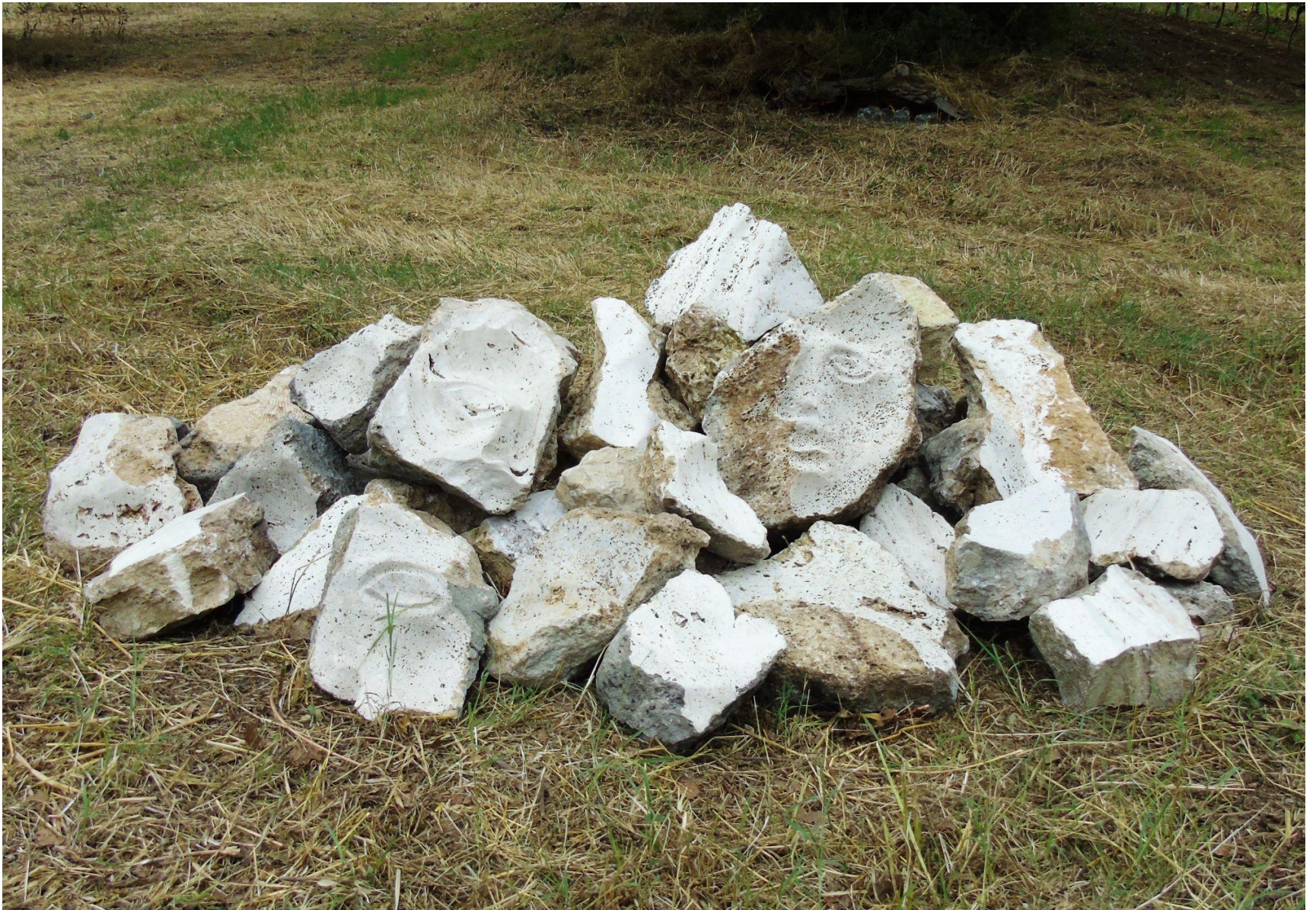
“A perdere” travertino 350 x 150 x 100 cm (Centobuchi, AP) 2021