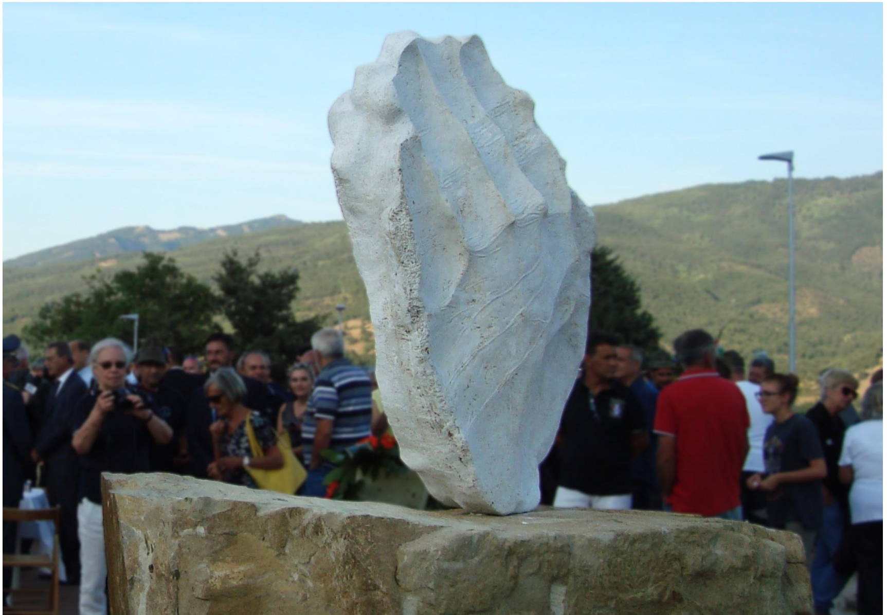
“Preghiera - Monumento alle vittime del terremoto di Accumoli”, travertino, tufo 320 x 120 x 100 cm, 2017. Accumoli