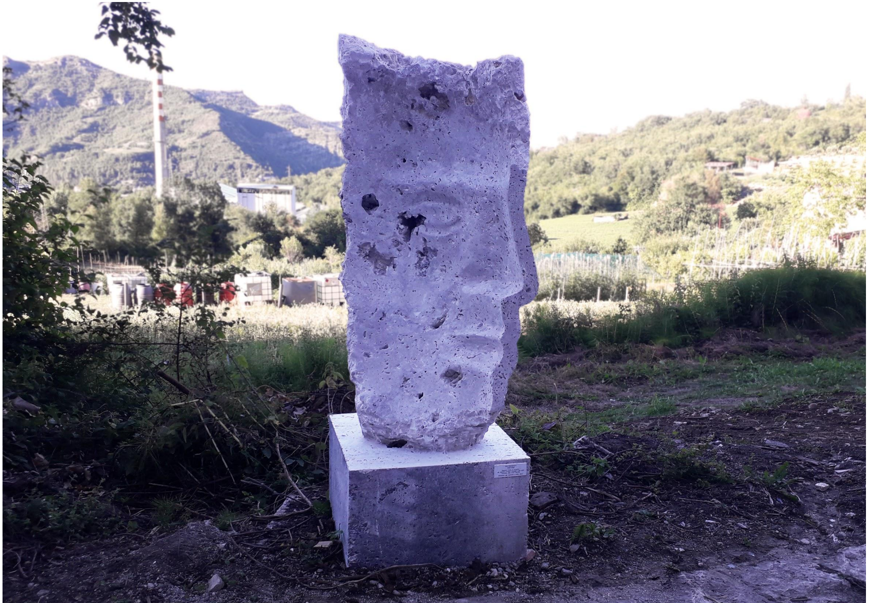
“Vertigo”, travertino 165 x 80 x 80 cm, 2020. simposio “Trame di Travertino”, ubicata in “Antica Mulattiera” (Paggese - Ascoli Piceno)