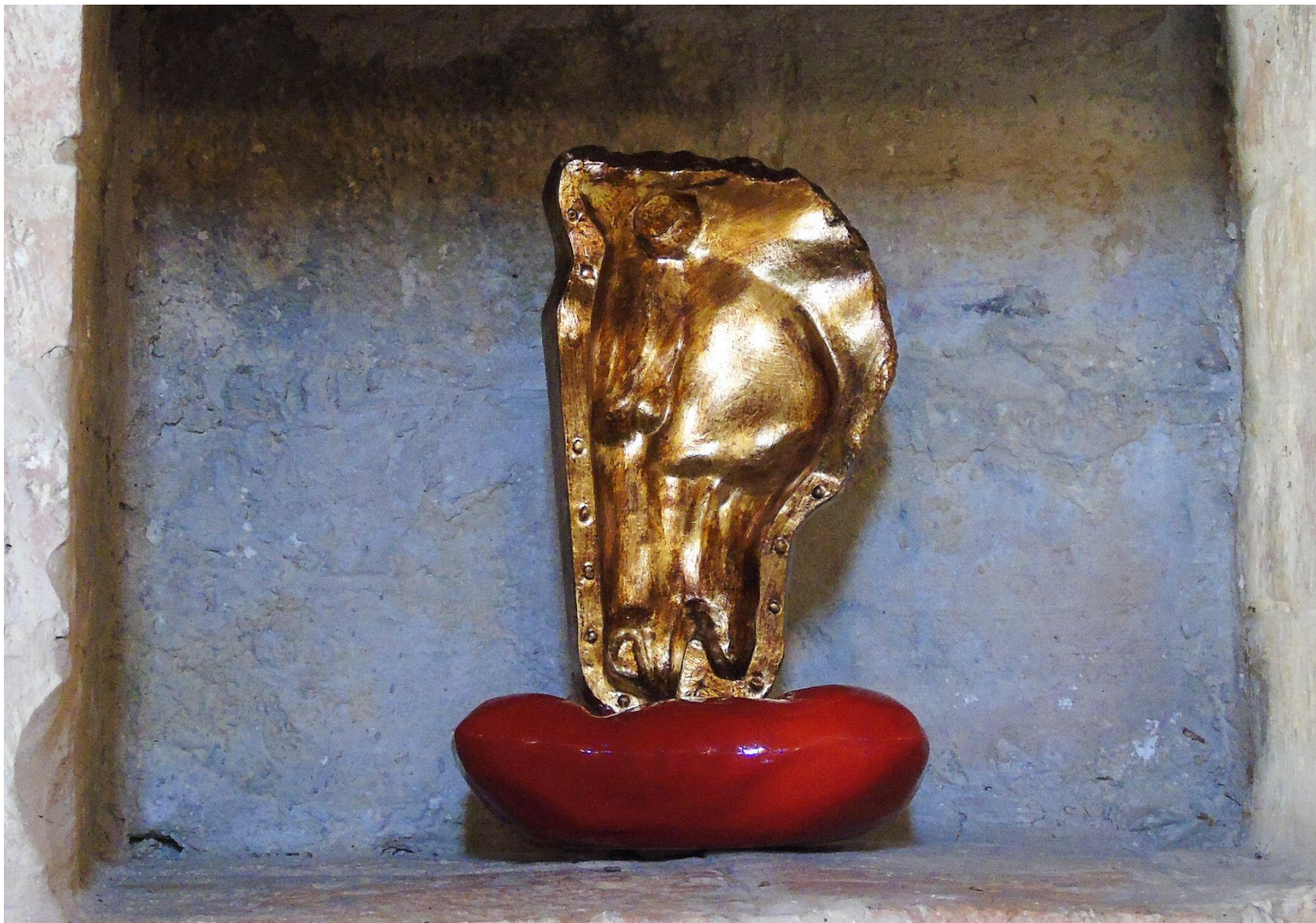
“Formatura Ornamentale #2”, gesso alabastrino, foglia similoro, smalto sintetico, mordente, 28 x 20 x 10 cm, 2021