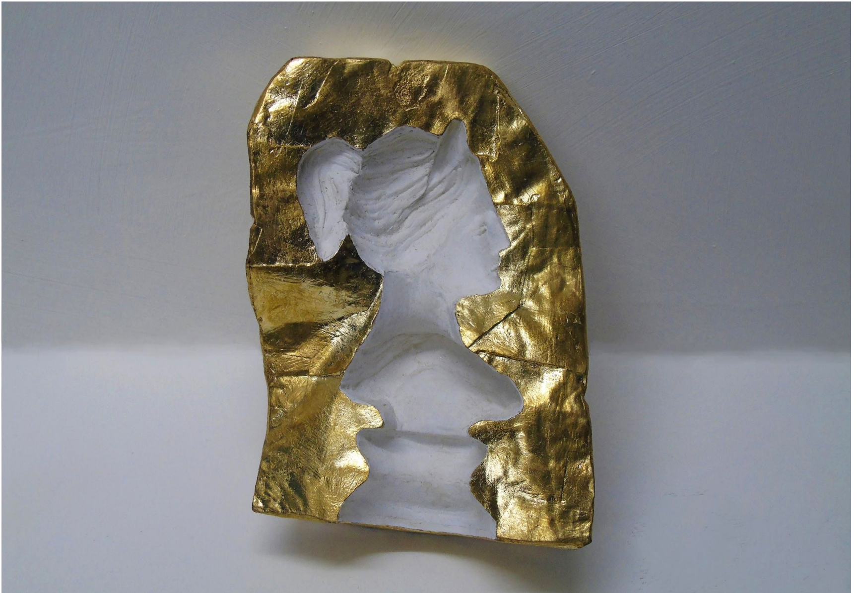
“Artemide (#2)”, gesso alabastrino e foglia similoro 15 x 10 x 8 cm, 2020