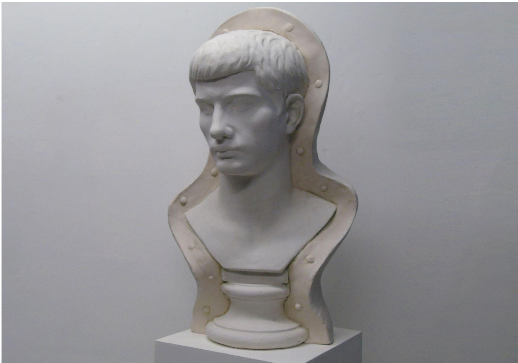
“Studio dell’antico”, gesso alabastrino e pigmento, 60 x 45 x 35 cm (particolare).