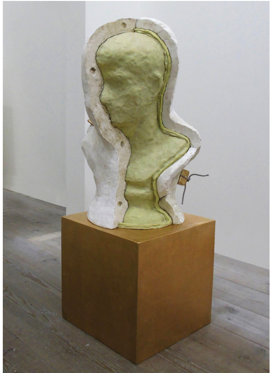
“Formatura” gesso, gomma siliconica, ferro e legno laccati 120 x 50 x 45 cm, 2019. “GATE 47”