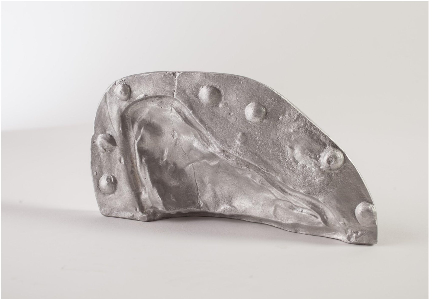
“Memoria”, alluminio 20 x 15 x 10 cm, 2019 (foto fronte)