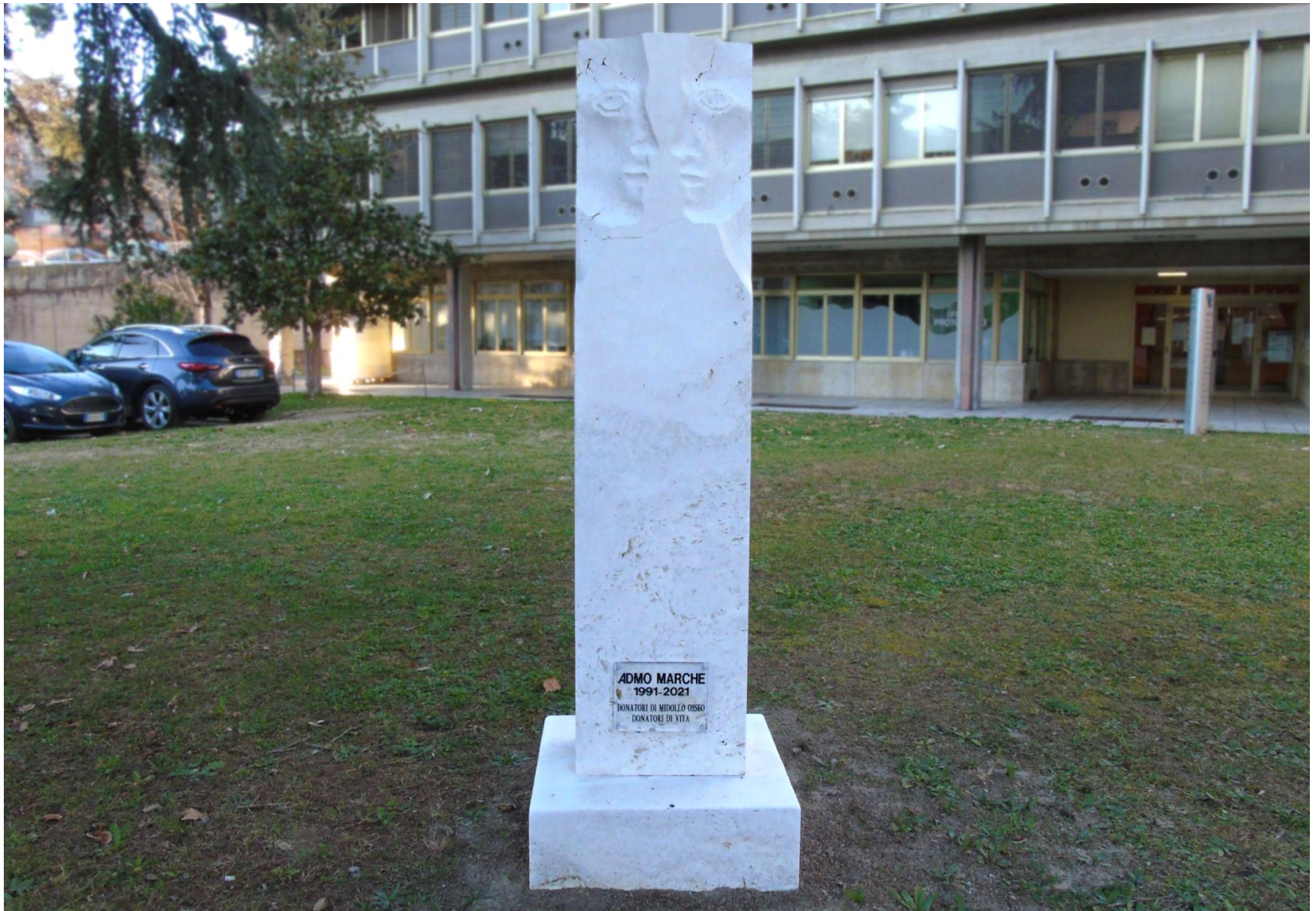
“Gemello Genetico- Monumento ai donatori di midollo osseo sez. Marche ” travertino 190 x 60 x 60 cm (Ospedale mazzoni, AP) 2021