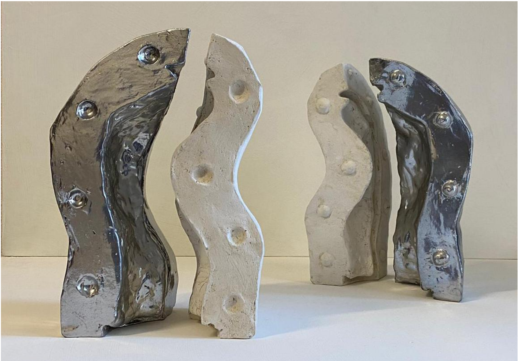
“Incontri”, gesso alabastrino e spray cromato, dimensioni variabili, 2020