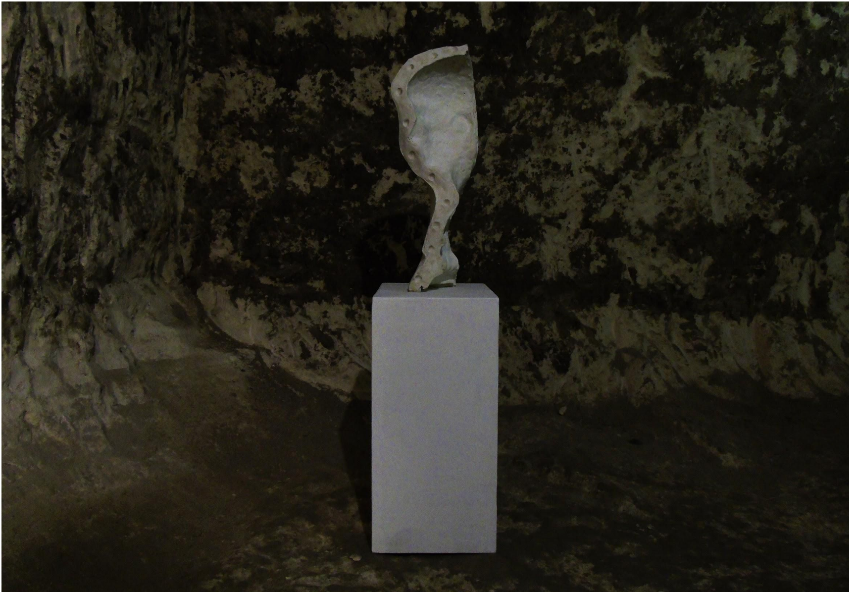
“Formatura come forma”, gesso, legno dipinto, 145 x 35 x 30, 2019. “Logos Mundi”, Ipogeo Materasum, Matera