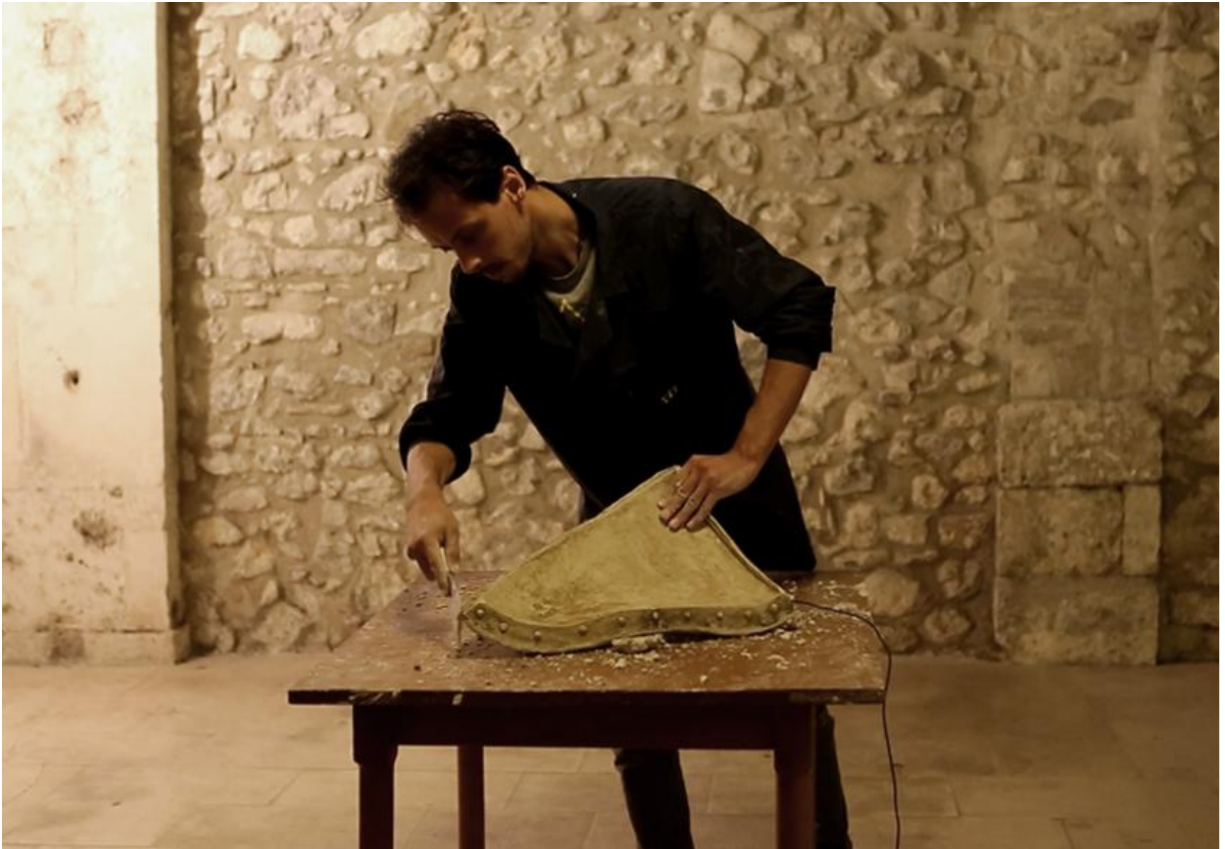
“Suoni di costruzione” installazione e performance videodocumentata, 2019. Residenza RaMO_05 , Caramanico Terme - Screenshot dal video di RÀ di Martino.