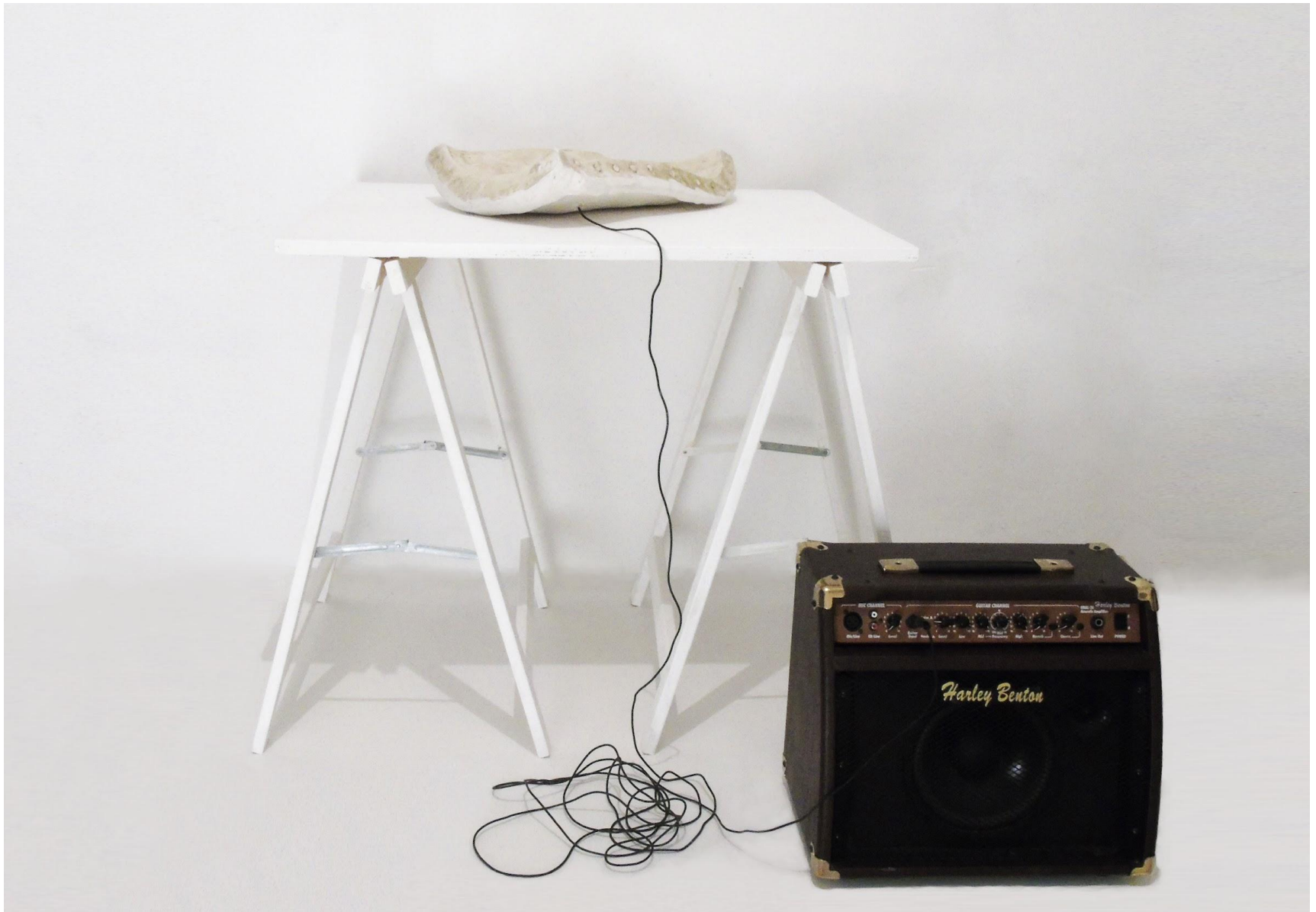
“Suoni di costruzione” installazione, gesso alabastrino, cicalino piezoelettrico, amplificatore, dimensioni variabili, 2020