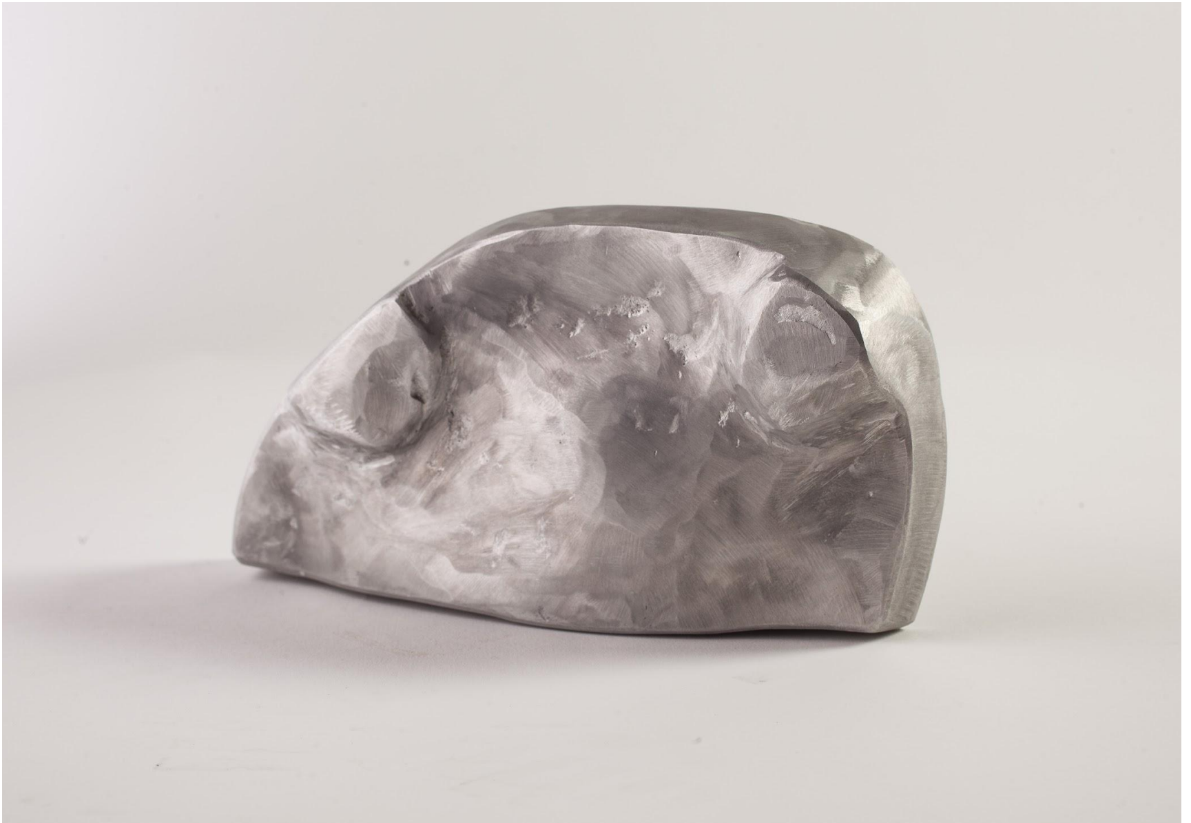
“Memoria”, alluminio 20 x 15 x 10 cm, 2019) (foto retro).