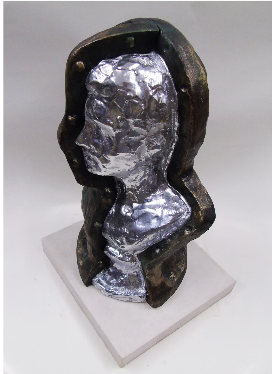
“Formatura ornamentale” gesso alabastrino patinato 30 x 17 x 15 cm, 2019)