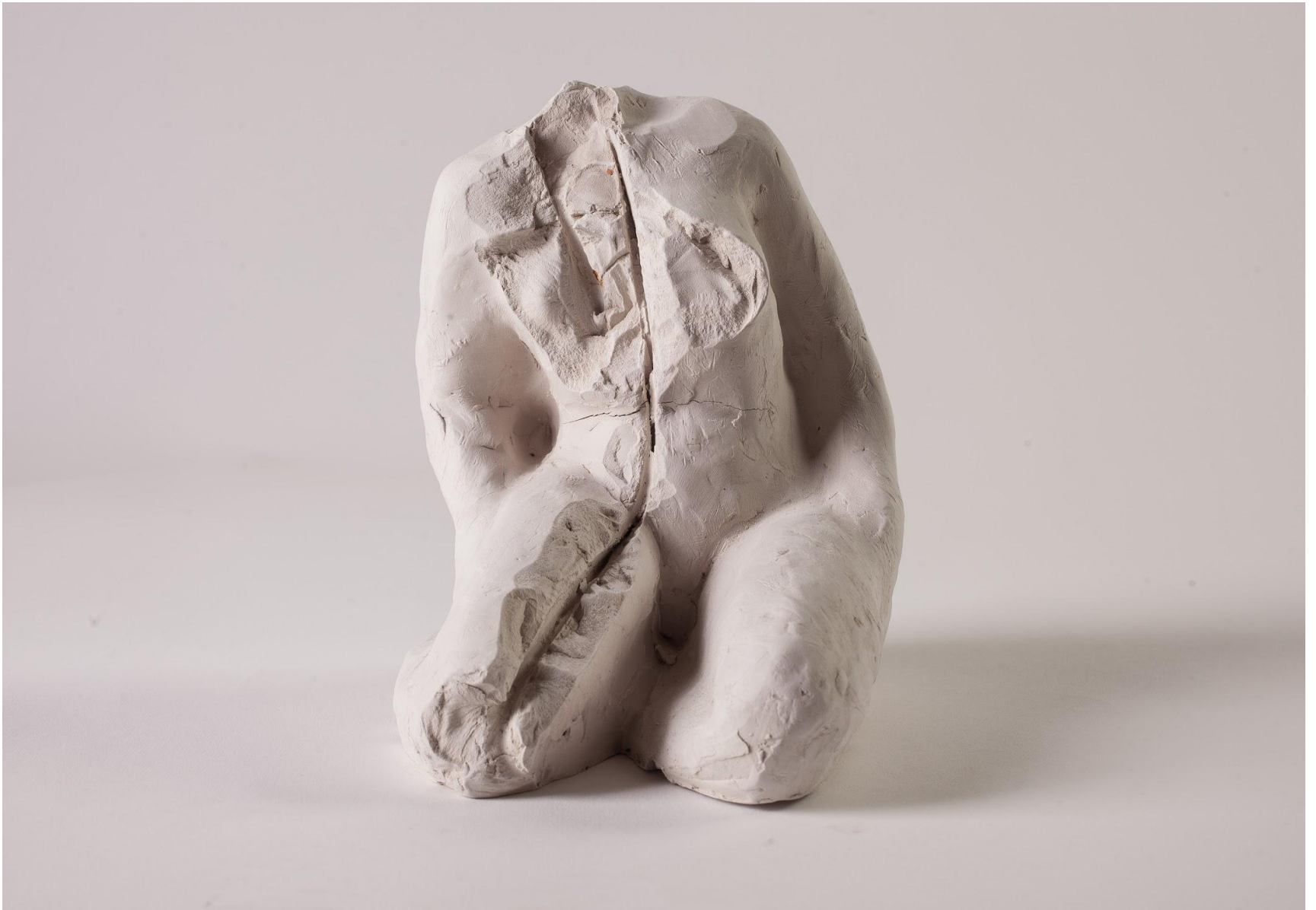
“Modellato” argilla bianca 16 x 12 x 15 cm, 2019