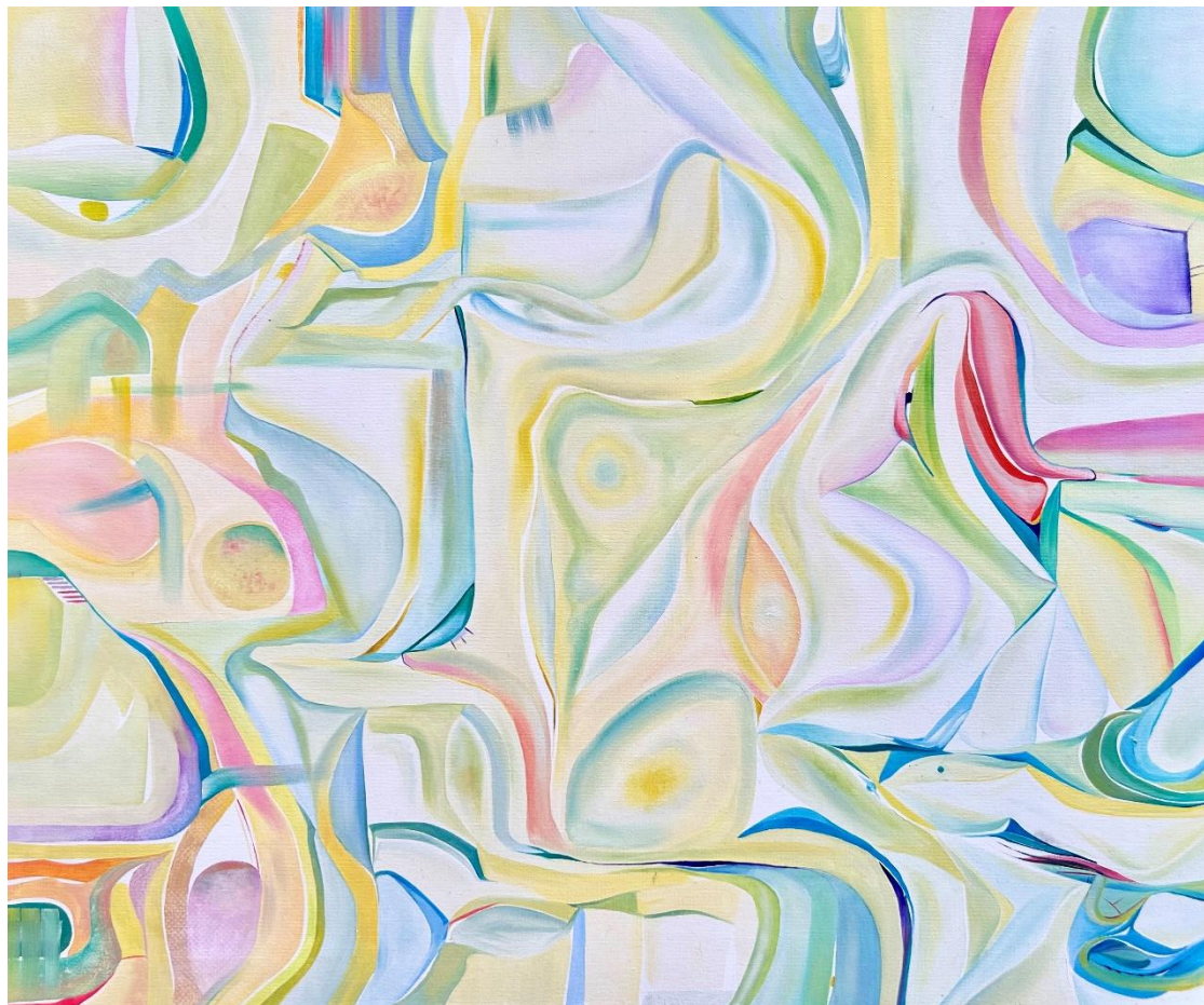
Mangiami, 2022 Olio su tela, 50x60 cm