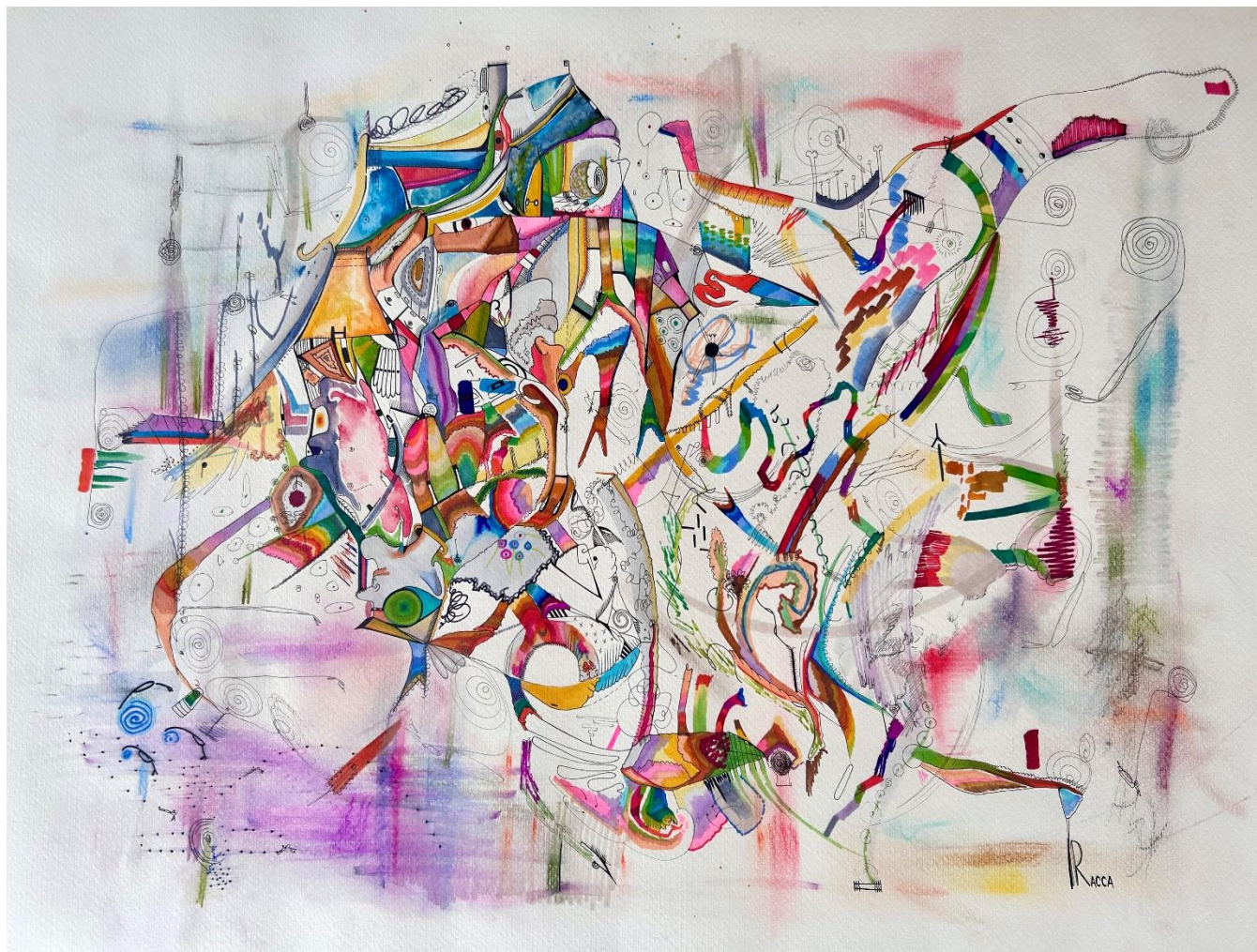
Lumache in fila, 2023 Tecniche miste, 50x70 cm