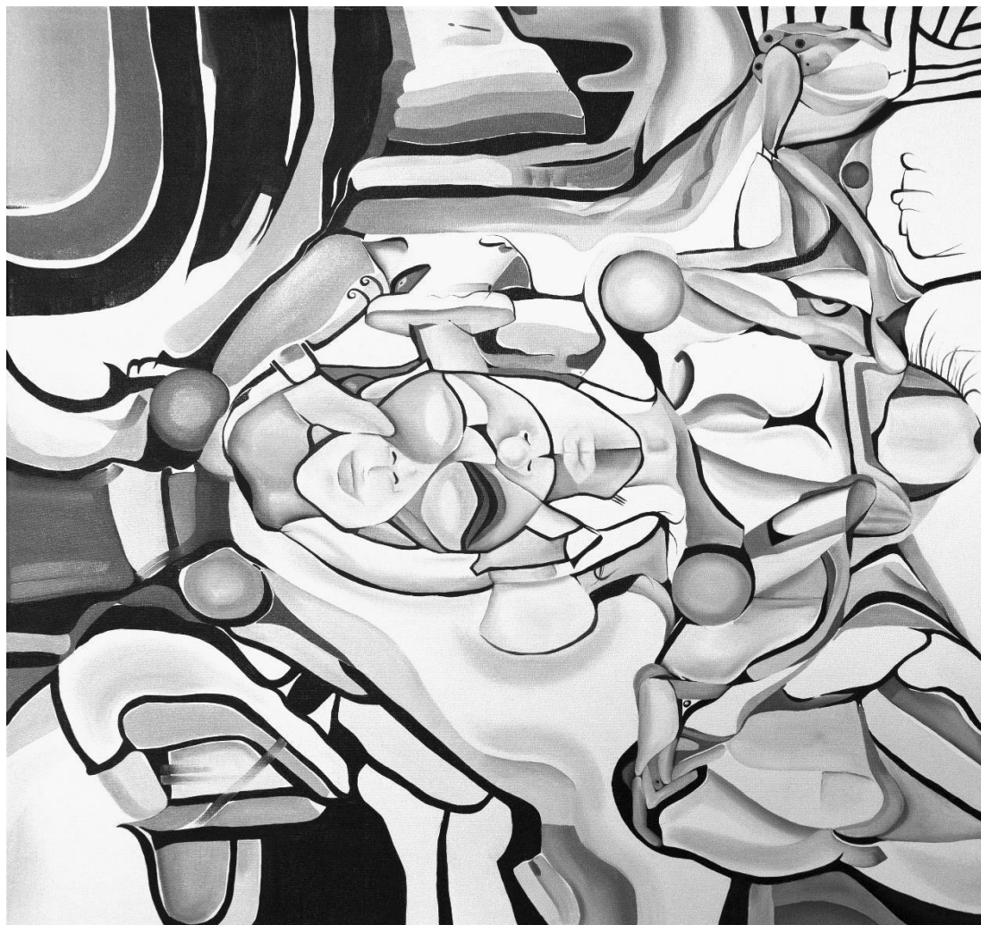
La giostra del pensiero, 2021 Olio su tela, 80x80 cm