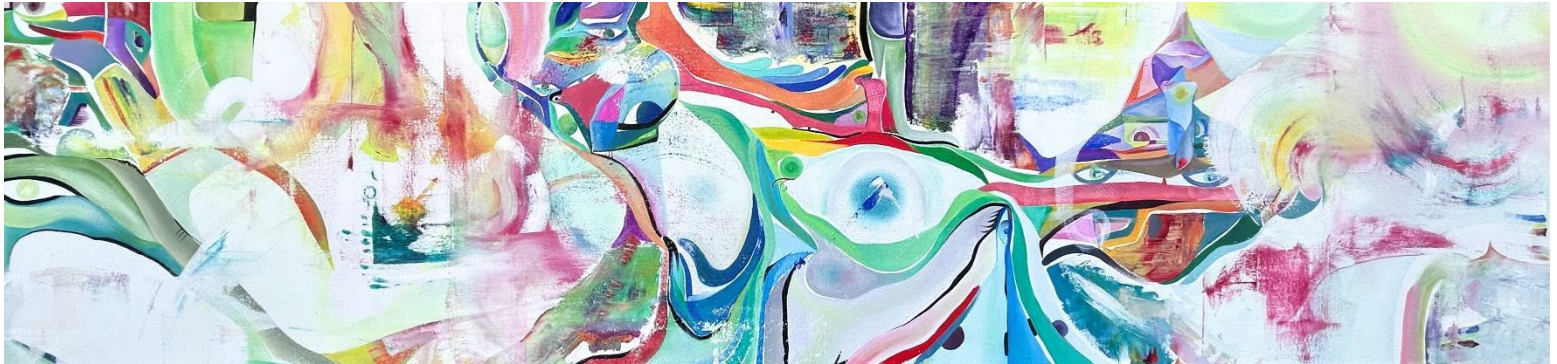
Respirando, 2023 Olio su tela, 30x120 cm