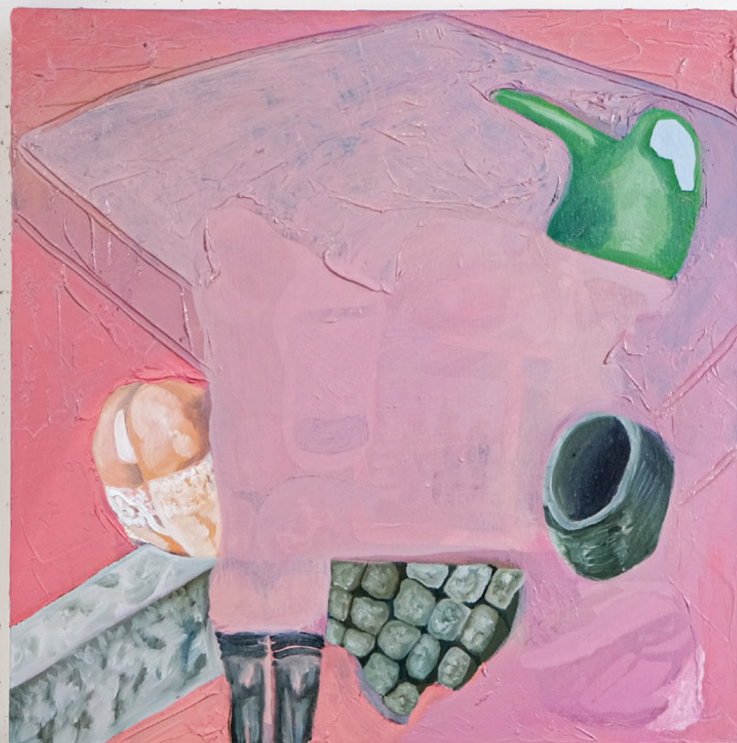
Composizione in pasta rosa, 2021 50 x 50 cm mixed media on canvas