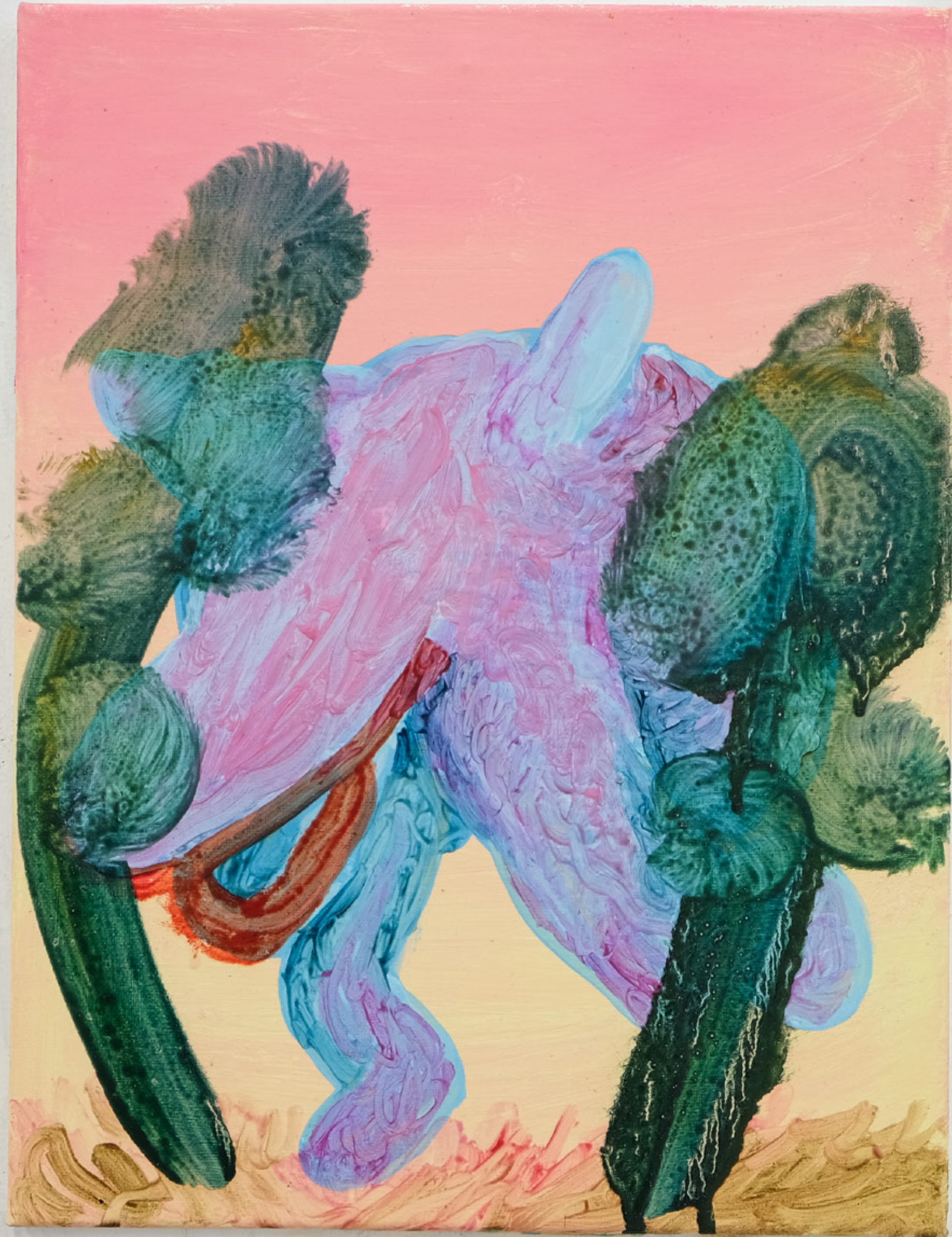
The shy , 2021 40 x 30 cm mixed media on canvas