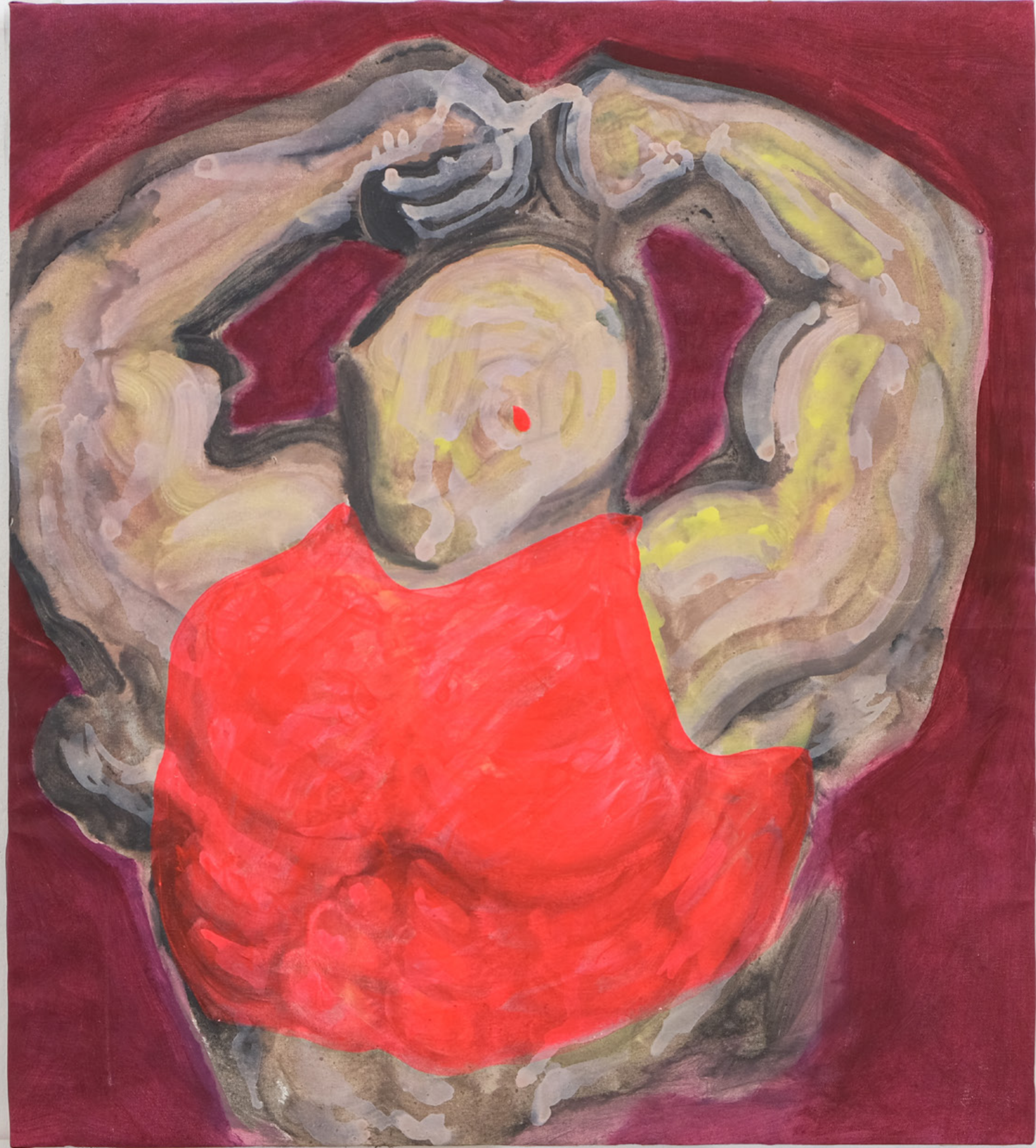
Musclecake, 2021 90 x 80 cm mixed media on canvas