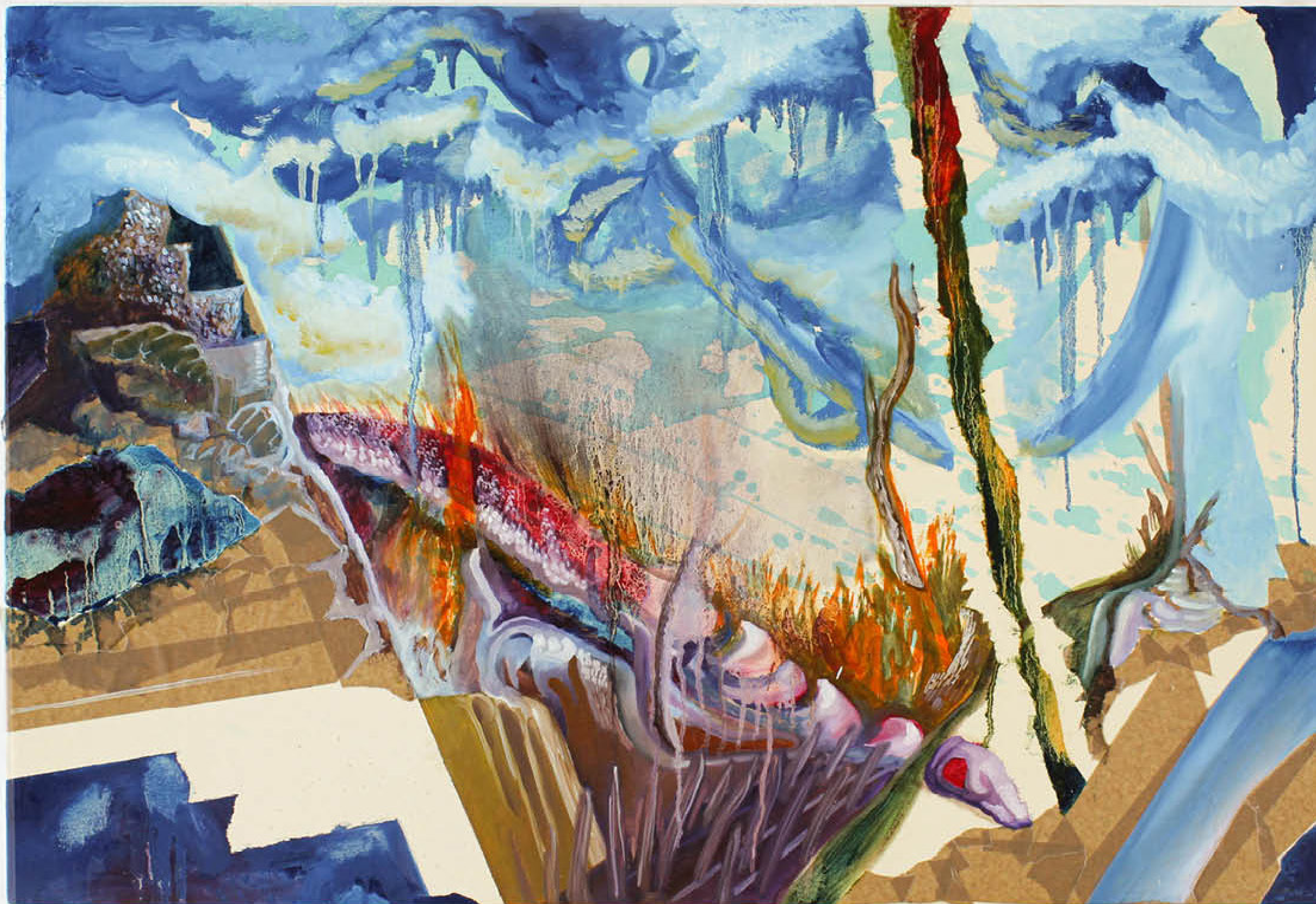
Quando il fulmine colpì quasi la testa del serpente, 2019