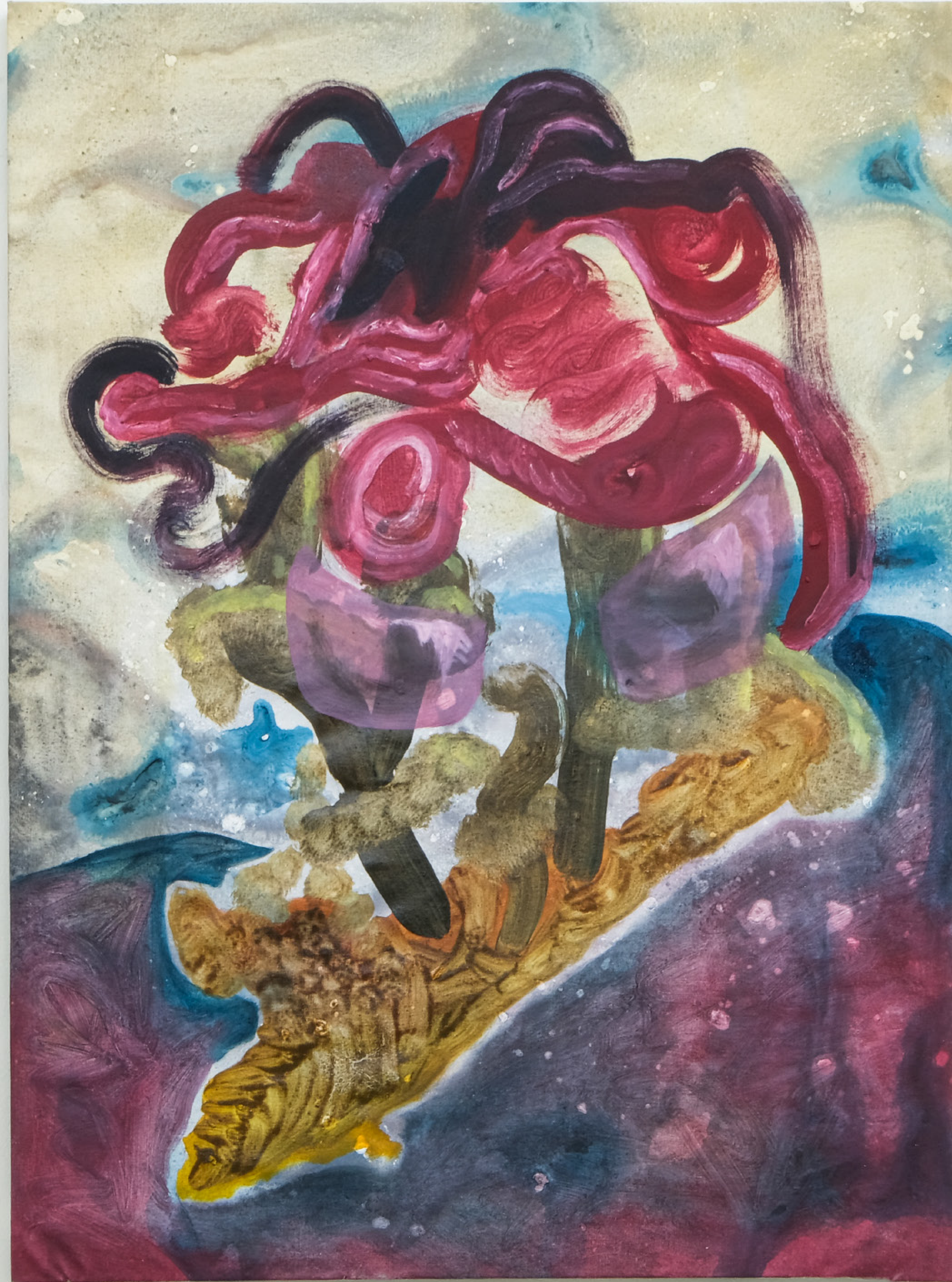
Spiderfucker , 2021 110 x 90 cm mixed media on canvas