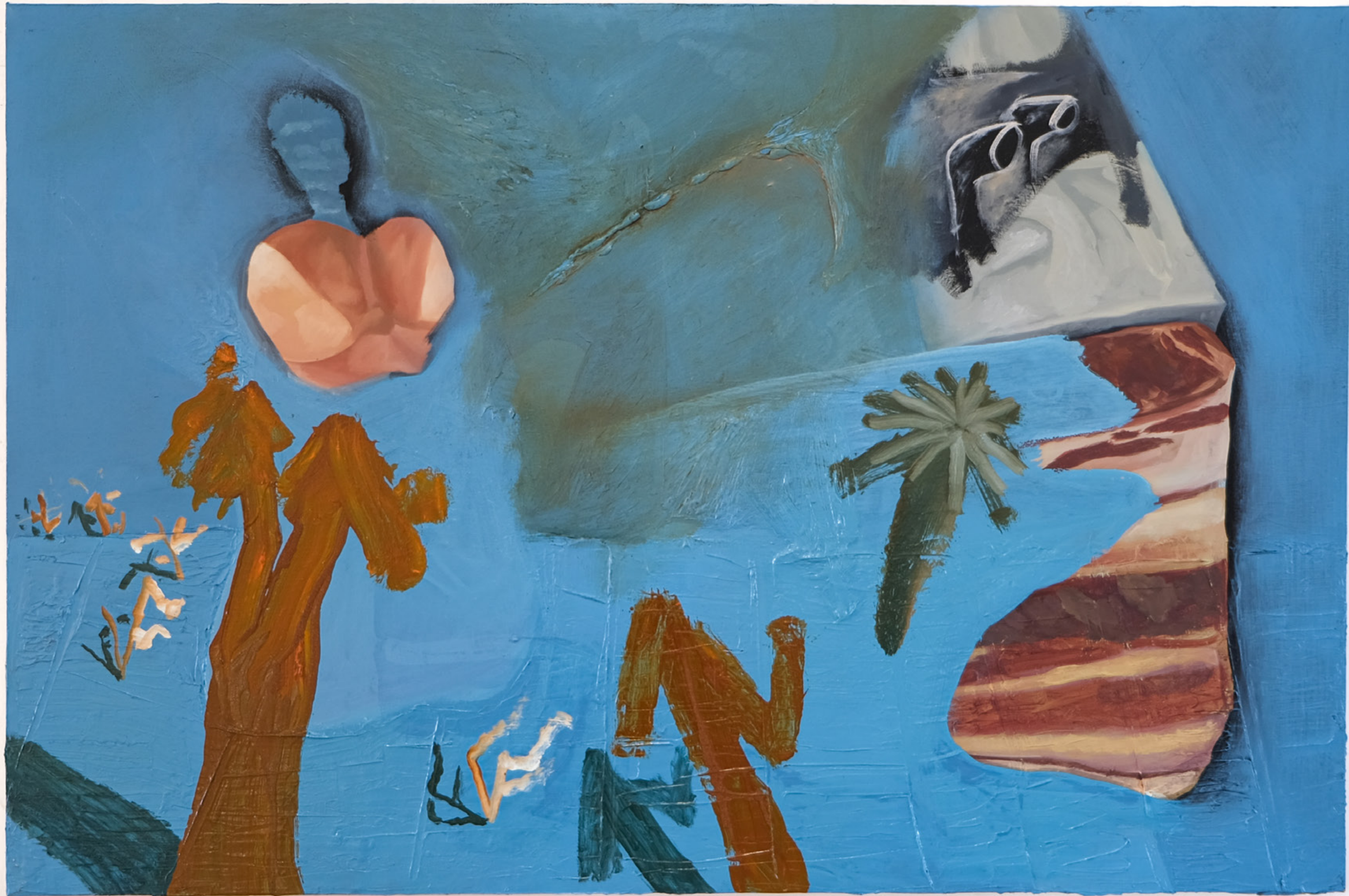
Celeste pesante, 2021 80 x 120 cm mixed media on canvas