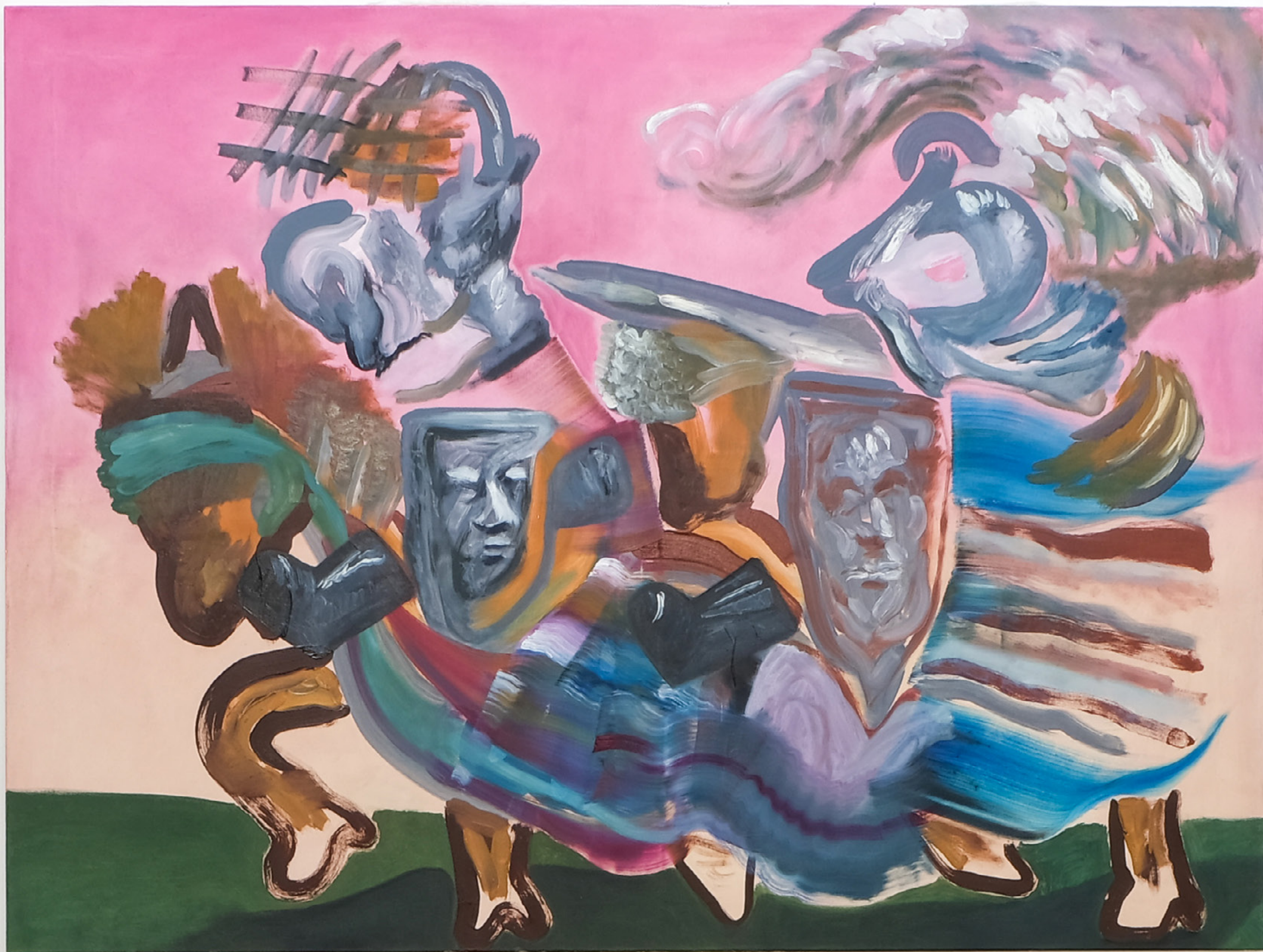
Tandem , 2021 120 x 160 cm Oil on canvas