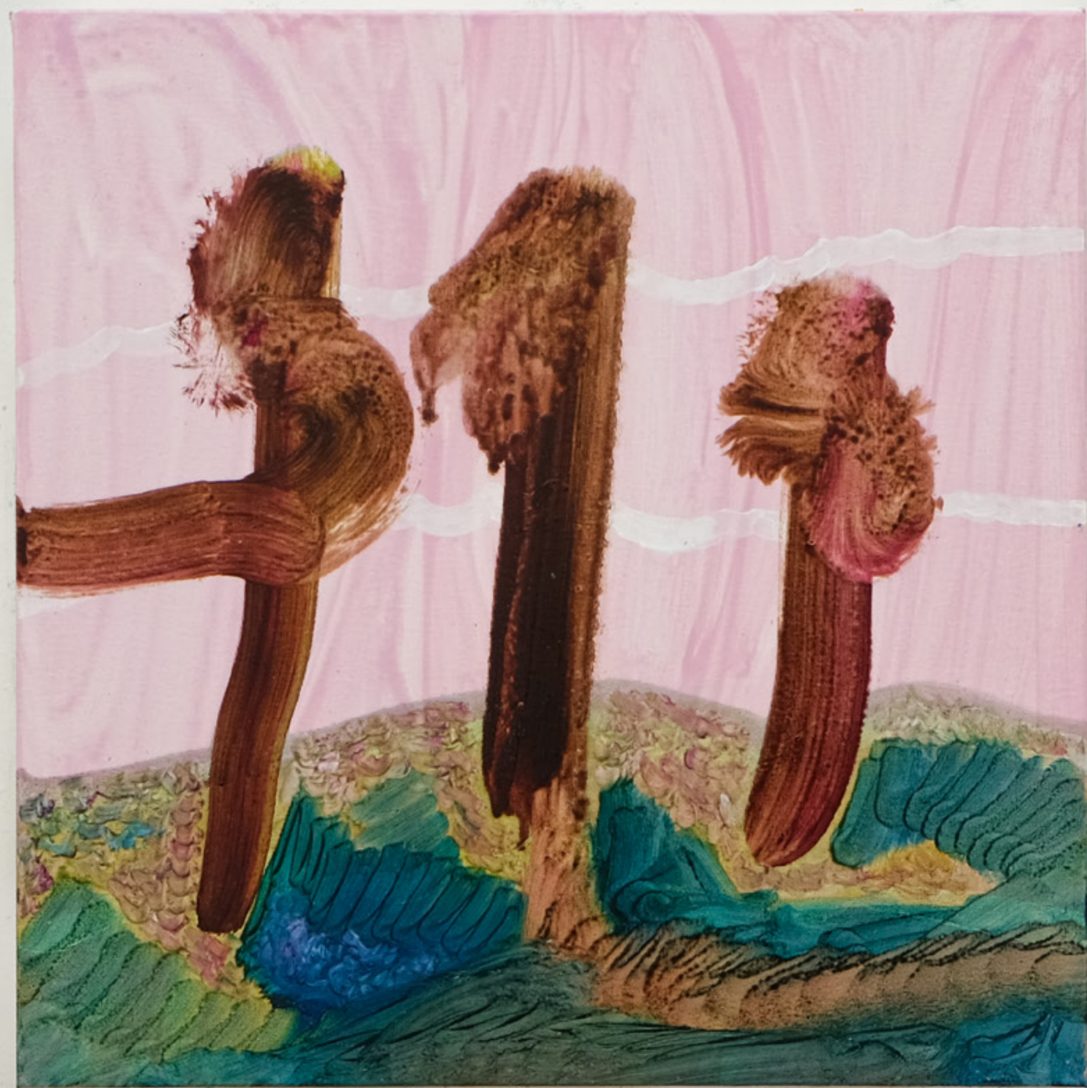
Golgota, 2021 50 x 50 cm mixed media on canvas