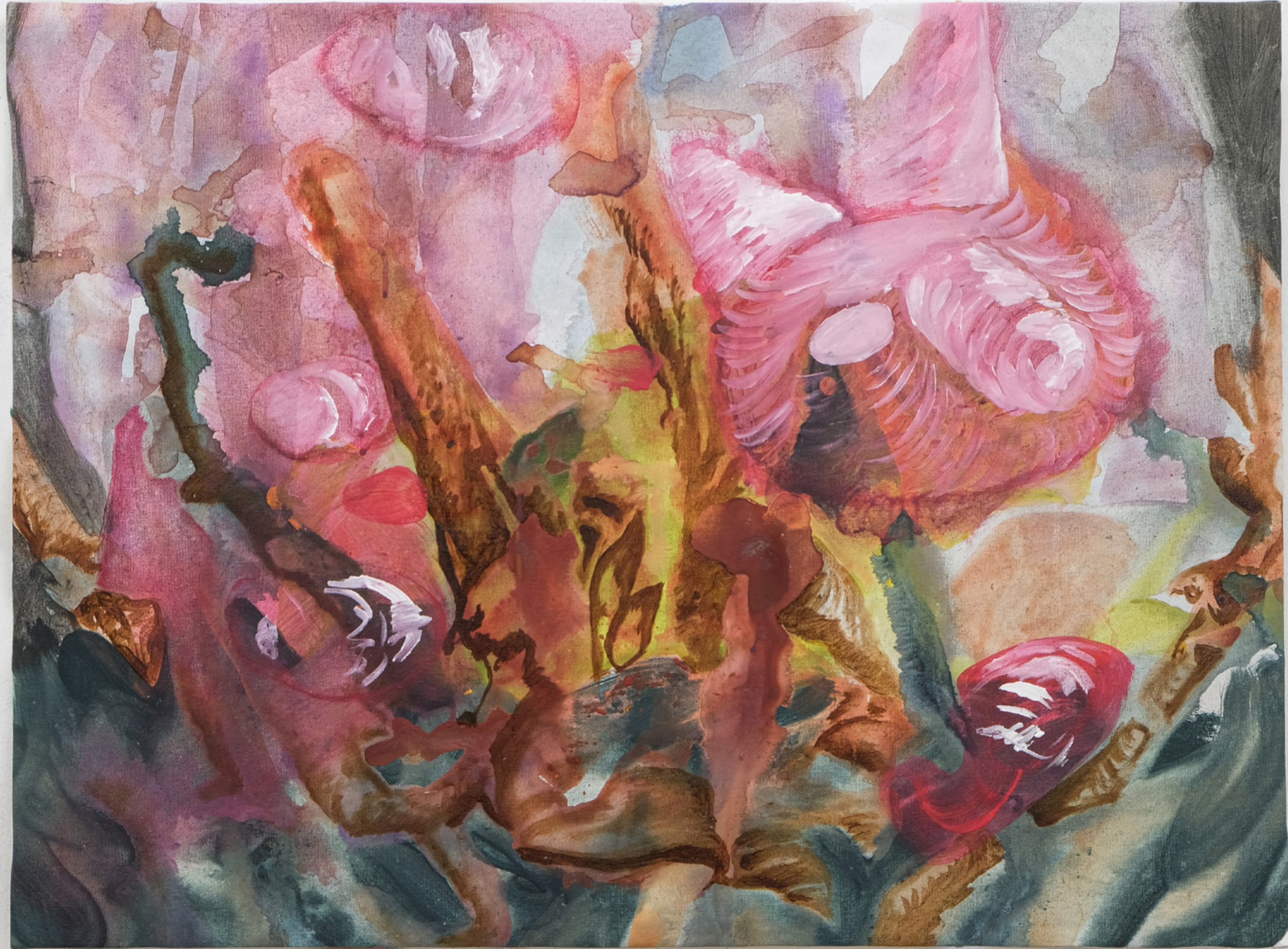
Gattochewingum, 2021 78 x 60 cm mixed media on canvas