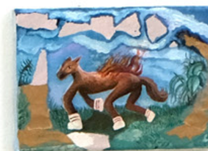
Nicola Fraticelli / portfolio 2019/2021