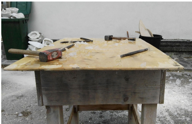
Titolo: Freeze Autore: Mara Albani, Angelica Reale Anno: 2019 Media: Scultura Materiale: Ghiaccio Durata: 00:30:00 minuti Luogo: Laboratorio esterno Scultura