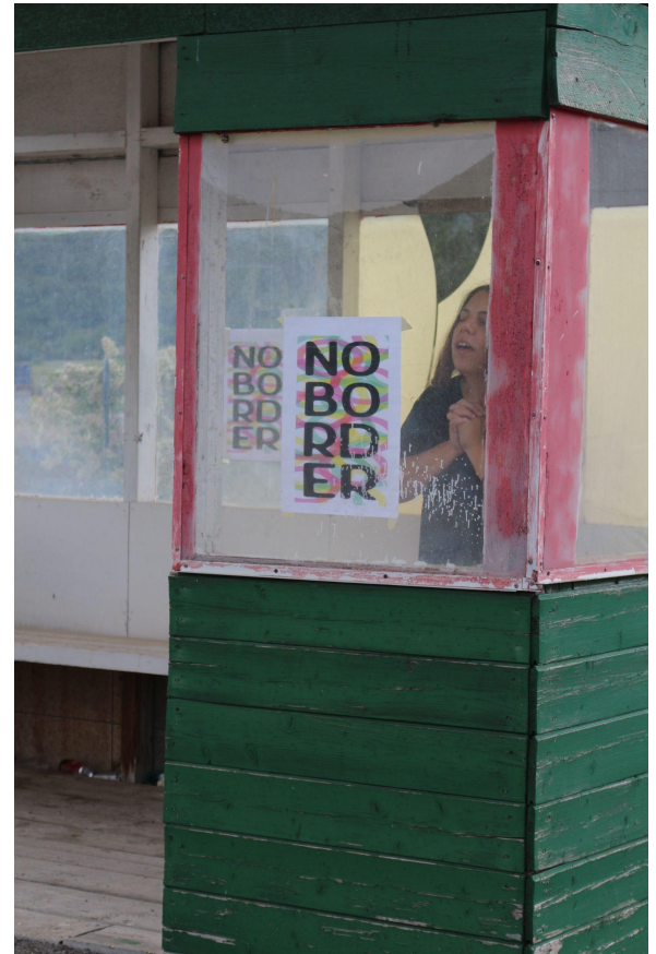
Titolo: L'Urlo Autore: Mara Albani Anno: 2021 Media: Scultura Materiale: Performance Durata: 2h Luogo: Pensilina SS17 Caporciano (AQ)